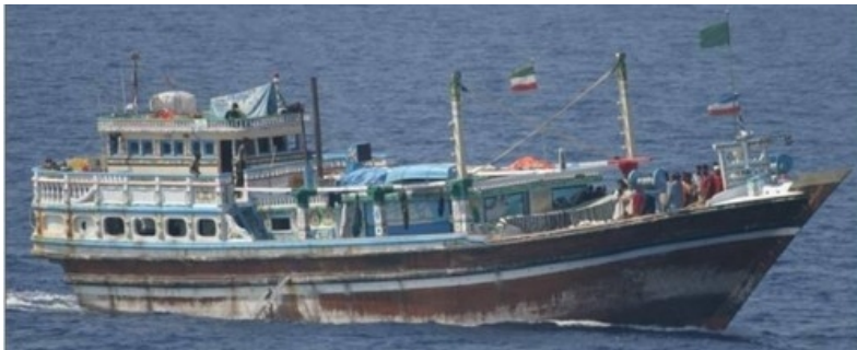
Afb. 3. Een 'Dhow', hier van het type 'Jelbut'.

Om het bereik op de Indische Oceaan verder te vergroten, maakten piraten steeds meer gebruik van gekaapte schepen (meestal dhows 7 maar ook andere schepen) die ze vervolgens als moederschip inzetten. Met deze moederschepen, met aan boord een of enkele skiffs , patrouilleren ze langdurig in het zeegebied.