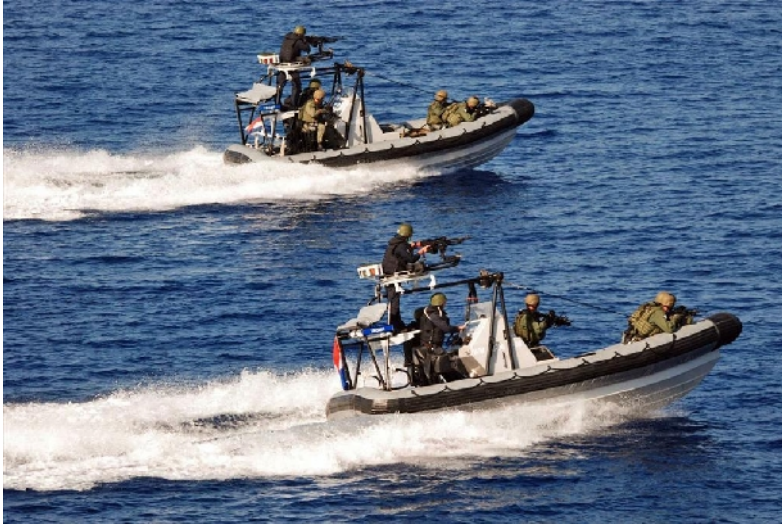
Afb. 5. Twee rhibs in actie vanaf Hr. Ms. Tromp

Subconclusie. De eenheden waren beschikbaar en waren zonder uitzondering geschikt voor het uitvoeren van de aan hen opgedragen taken. Voor een goede geïntegreerde voorbereiding dienen aanvullende eenheden de gehele transit naar het operatiegebied aan boord te zijn. Een herhaalde inzet van een Nederlandse onderzeeboot zal een waardevolle bijdrage vormen binnen de operaties. De rhibs van de grote bovenwatereenheden blijken niet volledig geschikt voor alle taken binnen het spectrum van antipiraterijoperaties. Bij de eventuele vervanging van de rhibs voor de grote bovenwatereenheden zullen de recente gebruikerservaringen moeten worden meegewogen.