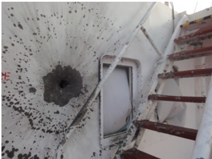
Afb. 4. De resultaten van de inslag van een granaat, uit een raketgranaatwerper, in de opbouw van een koopvaardijship.

Hoewel steeds meer koopvaardijshipen de geadviseerde BMP's toepassen, varen nog altijd koopvaardijshipen 9 zonder BMP's door het risicogebied.