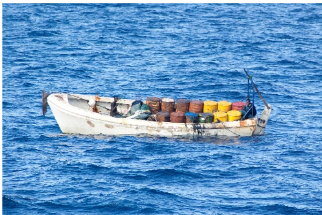
Afb. 2. Een Whaler.

Omdat de skiffs slechts een beperkte actieradius hadden gingen piraten naar zee met de steun van grotere boten. Met whalers brachten zij brandstof voor de skiffs mee.