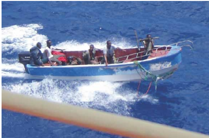
Afb. 1. Een Skiff van piraten tijdens een aanval op een koopvaardijship.

Sinds de eerste piraterijacties in de regio hebben de piraten hun tactieken voortdurend aangepast aan de veranderende omstandigheden. Enkele jaren geleden werden vooral vissersschepen gekaapt. Piraten kapen nu alle typen schepen. De Somalische piraten, toen nog grotendeels lokale vissers, maakten in die periode voor de kapingen gebruik van hun eigen skiffs (open vissersvaartuigen).