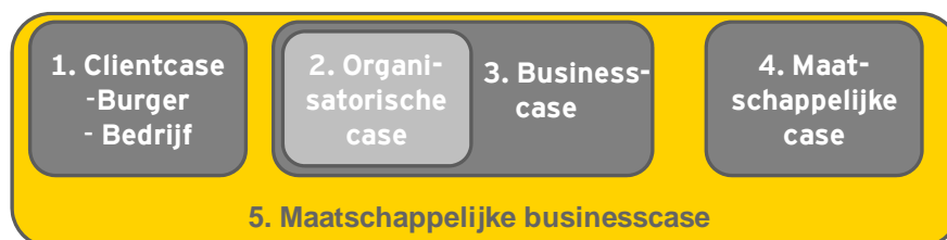
Figuur 1: maatschappelijke businesscase