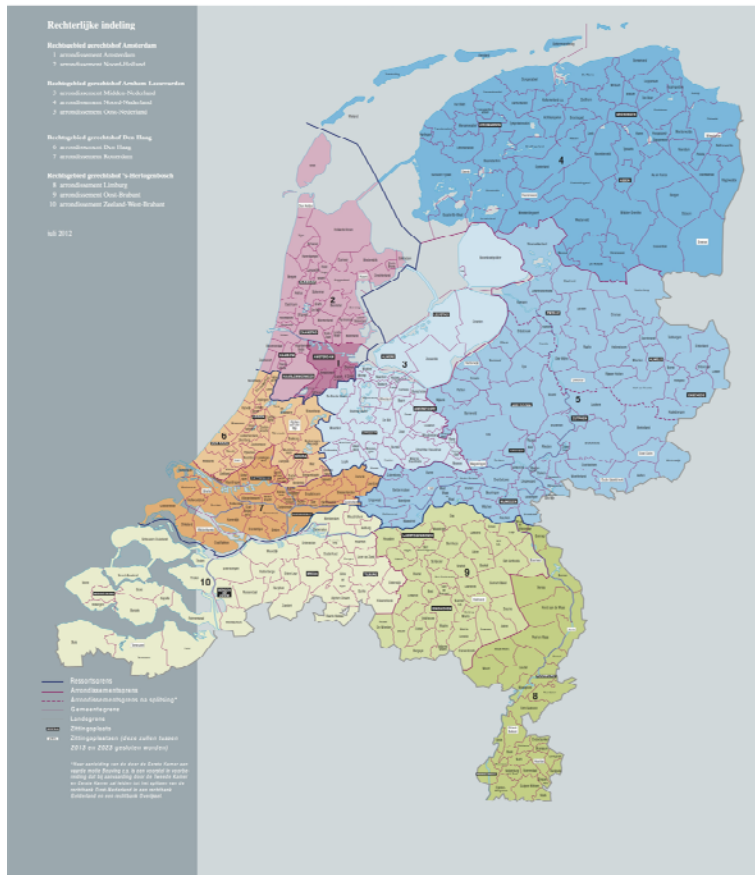
Rechterlijke indeling Nederland per 1 januari 2013

Per 1 januari bestaan de volgende gerechten: