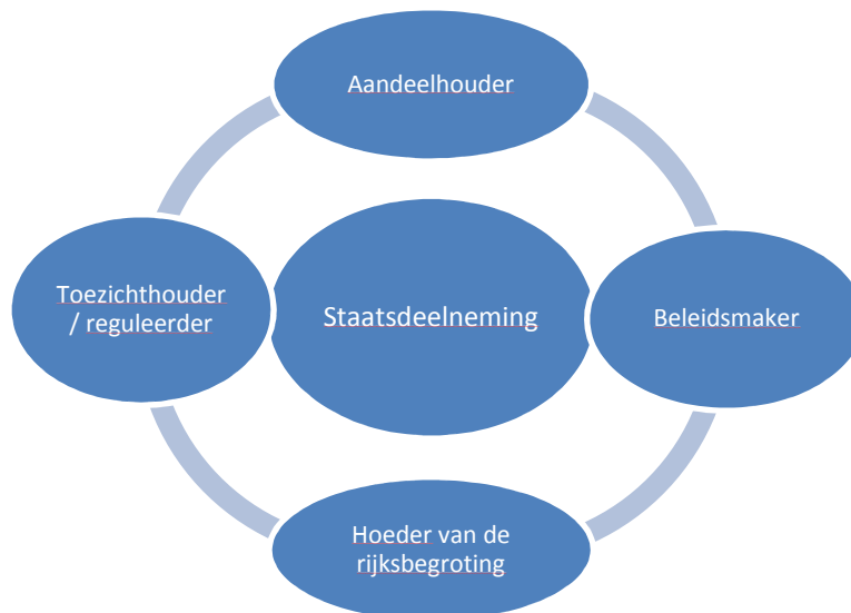
Figuur 1 Staatsdeelneming en de overheid