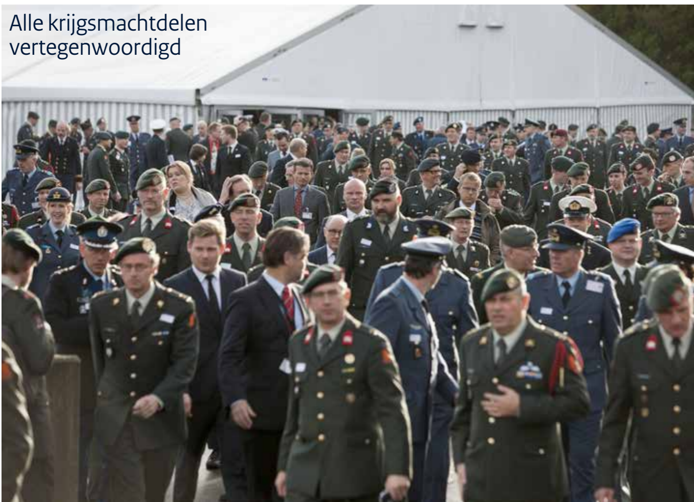
Alle krijgsmachtdelen vertegenwoordigd