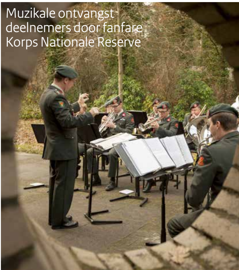
Muzikale ontvangst deelnemers door fanfare Korps Nationale Reserve