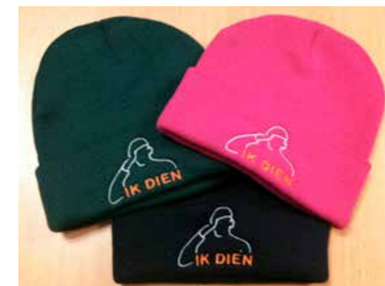
Een warm geschenk na afloop voor alle deelnemers

Het zou mooi zijn als mensen in Nederland over een aantal jaar niet alleen weten wat een reservist is maar dat velen een reservist kennen. En hopelijk zullen ook steeds meer mensen met gepaste trots zeggen: “Ik dien”.