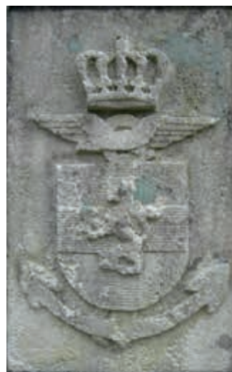
Wapen IGK bij de ingang van De Zwaluwenberg

De laatste jaren bevindt Defensie zich in roerige tijden. Veranderingen in de wereld om ons heen hebben vanzelfsprekend effect op de inzet van ons personeel, op het defensiebeleid en op de uitvoering van de taken. Ook in de toekomst zullen aanpassingen van onze organisatie nodig blijven. Bij de vele ontwikkelingen die ons raken, mogen we het welbevinden van onze mensen niet uit het oog verliezen. De Inspecteur-Generaal der Krijgsmacht zal zich daar altijd voor inspannen!