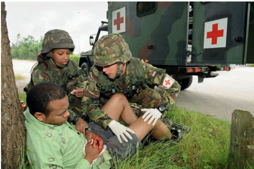
Noodhulp door personeel 400 gnkbat

weinig begrip voor de voorrang van de VeVa niveau 3-leerlingen ten opzichte van de ervaren manschappen bij de eenheid. Daarnaast vinden met name de onderofficieren dat Defensie onvoldoende werk maakt van het vertalen van leer- en werkervaring naar 'Eerder Verworven Competenties' (EVC's), die op de civiele markt begrepen worden. Ook constateren zij dat Defensie weinig doet om dit systeem voor het individu toegankelijk of inzichtelijk te maken.