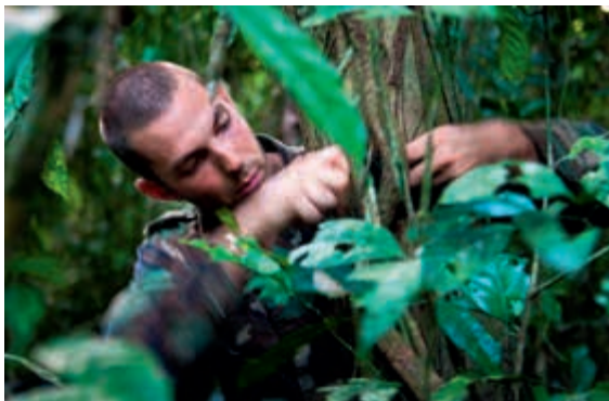
De kracht van zelfredzaamheid

Uitgangspunt bij de begeleiding in de bemiddeling is de zelfredzaamheid van het individu. Personeel in het herplaatsingstraject ervaart dat de aandacht van de organisatie vooral is gericht op het 'grip' krijgen op alle veranderingen als gevolg van de reorganisatie. Het contact met de organisatie verschuift na de overdracht van de herplaatsingskandidaat naar de BBO van de direct leidinggevende naar het 'anonieme' Dienstencentrum Human Resources. Behalve het als onpersoonlijk ervaren karakter daarvan waardeert men bovendien niet altijd de toonzetting van de automatisch gegenereerde brieven. Een formulering als "ik draag u op" in een plaatsingsbeschikking komt bij medewerkers eerder over als een disciplinaire maatregel dan een wederzijds gerespecteerd besluit.