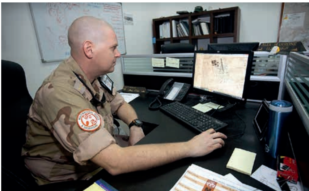
Solliciteren vanuit het buitenland is soms een uitdaging

is, het lastig vindt om een vervolgfunctie te bemachtigen. Dat geldt vooral wanneer de terugkeer naar Nederland eerder plaatsvindt dan was voorzien. Het DCIOD werd in dit verslagjaar geconfronteerd met mensen die vervroegd moesten terugkeren en voor wie nog geen vervolgplaatsing bekend was. Dit personeel komt dan terecht in de zogenaamde 'zwevende periode'. Een vervroegde terugkeer is sowieso ingrijpend voor deze werknemers en hun gezinnen omdat school, huur, emolumenten, fiscaliteiten, auto's en andere financiële consequenties een rol spelen. Vervroegde terugkeer leek daarbij vooral te worden veroorzaakt door een vermindering van het aantal Nederlandse functies in het internationaal functiebestand, in het bijzonder door de reorganisatie van de NATO Command Structure . Dit bestand bestond uit 491 functies en is met ruim honderd functies verkleind naar 387 functies. Mede doordat de precieze gevolgen van de reorganisatie bij Defensie pas in de loop van 2013 duidelijk werden, kon hier pas laat op worden ingespeeld. Zie ook mijn opmerkingen over functietoewijzing voor uitgezonden personeel in hoofdstuk 1.