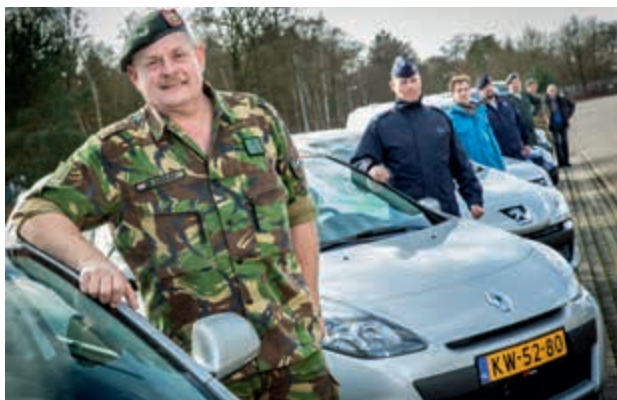
Extra projectcapaciteit door behoudgarantie

Medewerkers van wie de functie komt te vervallen en die voor 1 januari 2016 met leeftijdsontslag gaan, zijn in het SBK 2012 aangemerkt als een bijzondere groep. Dit personeel wordt niet aangewezen als herplaatsingskandidaat en men blijft tot de datum van het leeftijdsontslag in dienst bij Defensie. Meestal is dat op een reguliere functie, maar het kan ook een tijdelijke projectfunctie zijn.