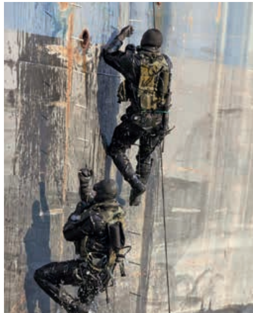
Langere plaatsingsduur voor specialisten gewenst

Ook in het werkbezoek aan de Netherlands Maritime Operations Forces (NLMARSOFF) werd aandacht gevraagd voor een betere invulling en borging van specialistische loopbanen. Specialistismen als kikvorsmannen en Mountainleaders vereisen langdurige en kostbare opleidings-trajecten, waarvan men bij voorkeur zo lang mogelijk rendement wil hebben in het operationele domein. Voor dit specialistische personeel zou in de ogen van het personeel een plaatsingsduur van minimaal drie jaar eerder regel dan uitzondering moeten zijn.