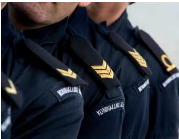
Perspectief op doorstroom blijft belangrijk

Veel militairen vinden dat de mogelijkheden voor doorstroom (te) beperkt zijn. Het vacaturesysteem en de sollicitatiemogelijkheden zijn vooral voor de manschappen beperkend, lastig en frustrerend. Zo wijst het jonge kader van het Vuursteuncommando (artillerie) op de beperkte doorstroommogelijkheden voor korporaals naar de Koninklijke Militaire School. Men pleit voor een grotere doorstroom in plaats van instroom. Er is bij de jongere kaderleden en commandanten