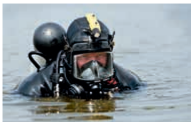
Bijstand door duikers DDG

Defensie is ook in 2013 veelvuldig incidenteel ingezet ter ondersteuning van de civiele autoriteiten bij de handhaving van de openbare orde en veiligheid, of de strafrechtelijke handhaving van de rechtsorde. Daarnaast verleende de krijgsmacht in 2013 hulp in het kader van het openbaar belang, bijvoorbeeld in geval van een ramp of zwaar ongeval, of ernstige vrees voor het ontstaan daarvan. Om de veelvoud aan inzet te illustreren zijn hieronder enkele concrete voorbeelden gegeven.