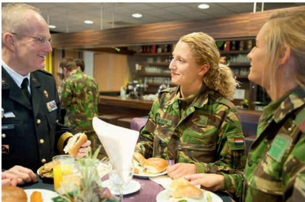
Werkbezoek IGK aan de staf van 13 Mechbrig

Zoals in iedere grote organisatie bestaat ook bij Defensie het risico van een kloof tussen beleid en uitvoering. Om de kans daarop te verkleinen verdiept de IGK zich voortdurend in de alledaagse praktijk 'op de werkvloer' en het effect dat Haagse beleidsmaatregelen daarop hebben. De Inspecteur-Generaal der Krijgsmacht en officieren van zijn staf bezoeken regelmatig alle werk-, oefen- en inzetlocaties van Defensie. Het is de bedoeling dat de Inspecteur-Generaal der Krijgsmacht alle onderdelen eens in de drie jaar bezoekt. Hij gebruikt deze bezoeken om de gevolgen van vastgesteld beleid in de praktijk terug te koppelen naar de commandanten van de Defensieonderdelen en de beleidsmakers. Daarnaast bieden deze contacten leiding gevenden de mogelijkheid met de Inspecteur-Generaal der Krijgsmacht problemen te bespreken die ze zelf niet kunnen oplossen.