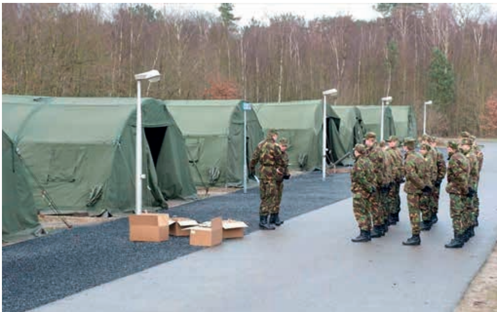
VeVa-cursist is geen militair, dus geen oefentolage voor de instructeur

“Personeel in een missiegebied merkt op dat de regelgeving voor repatriëring bij ziekte en overlijden van relaties niet langer goed aansluit bij de persoonlijke situatie van het uitgezonden personeel. In geval van een ernstige gebeurtenis is de formele mogelijkheid voor repatriëring gebaseerd op de formele status (familied eerste en tweede graad) en niet op de emotionele band die men heeft met betrokkene. De commandant ter plaatse zou een grotere stem moeten hebben bij het bepalen van uitzonderingen op de regel”.