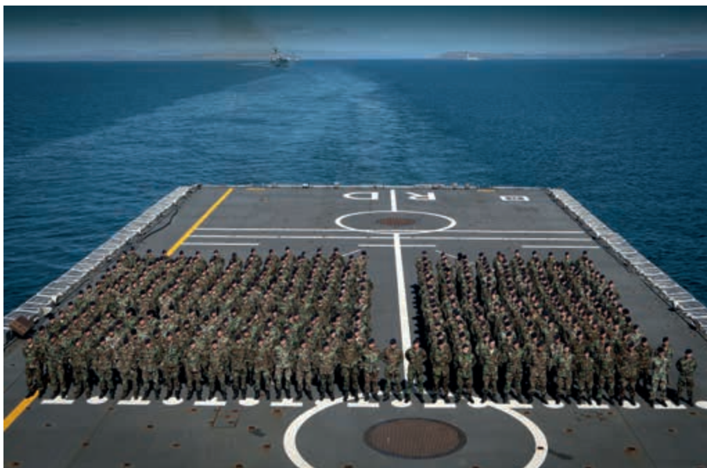
Commandant wil meer invloed op vulling

“Deels door de procesinrichting van mijn defensieonderdeel en deels door centralisering van besluitvorming richting Den Haag ervaar ik dat ik als commandant wel verantwoordelijk blijf maar (te) weinig regelruimte heb”.