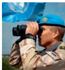
UNTSO-waarnemer aan de grens in Syrië

Nederlandse waarnemers maken al decennia lang deel uit van de United Nations Truce Supervision Organization (UNTSO) en dragen zo bij aan het handhaven van de afgesproken bestandslijnen tussen Libanon, Syrië en Israël. Vanwege ontwikkelingen in de veiligheidssituatie zijn de UNTSO-waarnemers teruggetrokken naar de Israëlische zijde van de bestandslijn.