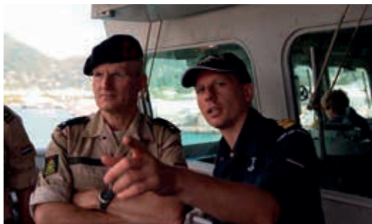
Werkbezoek IGR aan Zr. Ms. Van Speijk tijdens piraterijbestrijding

Van 25 juli tot 3 augustus 2013 heb ik een bezoek gebracht aan het personeel in de missiegebieden Zuid-Soedan, de Indische Oceaan, Afghanistan en Turkije. De doelstelling was kennis te nemen van de ervaringen, beleving en ideeën van ons uitgezonden personeel. Het accent lag daarbij op de taakuitvoering, aansturing, voorbereiding, instandhouding, ondersteuning en zorg.