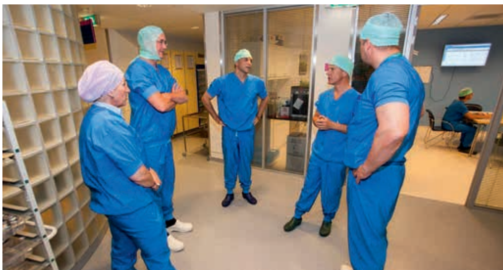
Ook aandacht voor verwerving bij het Centraal Militair Hospitaal

Bij het invoeren van specialistisch materieel is men vaak aangewezen op fabrieksopleidingen. Dit maakt een goede borging en 'follow-up' ten aanzien van het beheer en instandhouding van dit materiaal minder makkelijk. Al met al acht men het noodzakelijk dat nog eens goed wordt gekeken naar alle genoemde deelprocessen in de materieellogistieke keten om de inzetgereedheid van speciale eenheden in de toekomst te kunnen blijven garanderen.