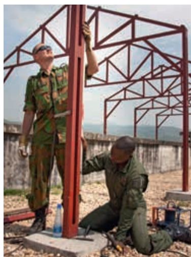
Inzet geniespecialisten in Burundi

Nederland neemt verder deel aan de Europese Trainingsmissie (EUTM) voor Somalië. Hoofdtak van de missie is het trainen van Somalische veiligheidstroepen om de nieuwe regering van Somalië te versterken. Dit gebeurde tot 1 januari 2014 vanuit de Oegandese hoofdstad Kampala en het Bihanga Training Camp in het westen van Oeganda. De trainingsmissie is inmiddels verplaatst van Oeganda naar Mogadishu, de hoofdstad van Somalië.