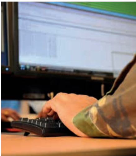
Toegang tot internet beperkt

Ook tijdens een bezoek aan Zr.Ms. De Zeven Provinciën kwam ter sprake dat het personeel in belangrijke mate vanaf functie wordt opgeleid. Voor de functionele begeleiding is de leermeesterfunctie aan boord echter verdwenen, waardoor het overdragen van kennis en ervaring voor een groot deel op de schouders rust van de oudere onderofficieren. Daardoor kunnen zij minder aandacht besteden aan hun rol als chef. De werkdruk wordt door deze categorie als hoog ervaren.