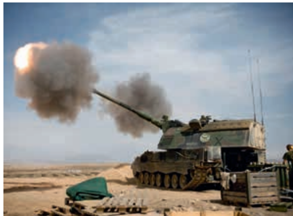
Reservedelen belangrijk voor operationele capaciteit

Inzetbaarheidsproblemen zijn er ook bij het Vuursteuncommando van het Operationeel Ondersteuningscommando Land met betrekking tot de Pantserhouwitzer. Deze problemen zijn eveneens gerelateerd aan de beperkte beschikbaarheid van reservedelen. Voor het mortier 120 mm is het meestal een kwestie van slijtage en te grote speling op bewegende onderdelen. Van dit wapensysteem zijn echter nog voldoende reservestukken voorradig. Hierdoor kan men onderdelen relatief makkelijk vervangen, waardoor slijtage niet direct zal leiden tot een verminderde inzetbaarheid.