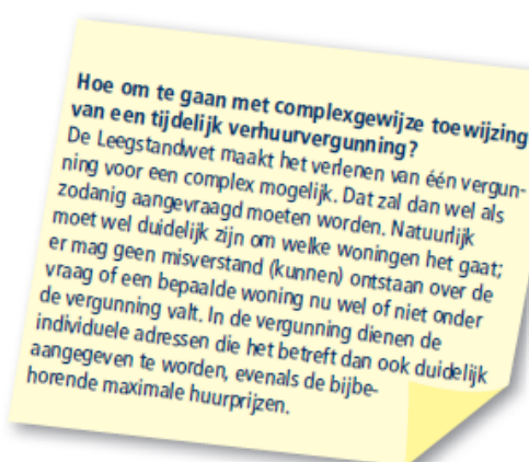
Factsheet tijdelijke verhuur Leegstandwet van VNG en Ministerie van BZK

Uit cijfers van de makelaarsvereniging NVM Business blijkt dat eind 2013 ruim 8 miljoen m 2 kantoorruimte te huur of te koop stond. Dat komt overeen met bijna 17% van de totale kantoorruimte in Nederland. Breed wordt dan ook de wens gedragen om een nieuwe bestemming te vinden voor de leegstaande kantoorruimte. Het ministerie van BZK heeft daarom een Expertteam Kantoortransformatie ingesteld, dat gemeenten en eigenaren praktische ondersteuning biedt bij de transformatie. Uit de 'Rapportage van het eerste jaar Expertteam kantoortransformatie' blijkt dat er in 2012 zo'n 15 kantoorpanden mogelijk getransformeerd zouden gaan worden. Het gaat om beperkte aantallen en