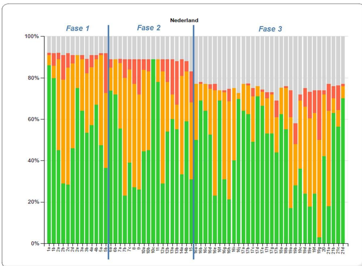
Figuur 1: Resultaten Transitiemonitor Jeugd – Nederland – meting 23 mei 2014

59% van alle gemeenten heeft de antwoorden van fase 1 en 2 geupdated. Daarom ligt het percentage gemeenten dat de antwoorden heeft ingevuld op deze vragen hoger dan van fase 3. In het hierna volgende diagram is per vraag weergegeven wat gemiddeld landelijk de antwoorden zijn (groen is 'Ja', oranje is 'Ten dele', rood is 'Nee en grijs is 'Niet ingevuld'). Op de x-as zijn de vraagnummers weergegeven (de vragenlijst is opgenomen in bijlage 2). In bijlage 1 is onderstaand overzicht in verband met de leesbaarheid in groter formaat opgenomen.