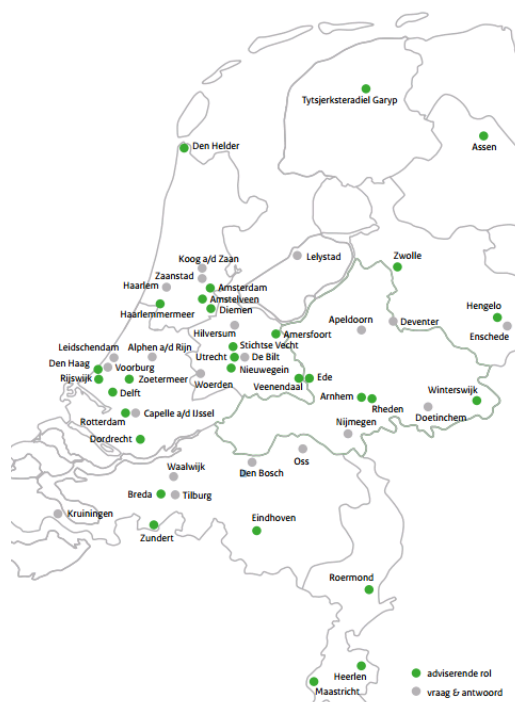
Overzicht van plaatsen waar het Expertteam betrokken was bij projecten; situatie april 2014

De leegstand van kantoren is een omvangrijk probleem. Het Planbureau voor de Leefomgeving publiceerde begin 2014 dat ongeveer 17% van de kantoorruimte in Nederland leeg stond. In totaal gaat het om 8,5 miljoen m 2 en de leegstand zal in de komende jaren nog verder toenemen. Het rijk is samen met de markt intensief bezig om de transformatie van kantoren naar woonruimte te bevorderen. Onder meer is in 2012 door het ministerie van BZK en de VNG een Expertteam (Kantoor)transformatie ingesteld, dat gemeenten en eigenaren praktische ondersteuning biedt bij de transformatie van kantoren en sinds 2014 van ook maatschappelijk vastgoed in woonruimte. Inmiddels zijn in tal van gemeenten initiatieven ondersteund (zie bijgevoegde kaart). De geïnitieerde projecten hebben voor het merendeel betrekking op een definitieve transformatie van kantoren naar woonruimte, maar met de