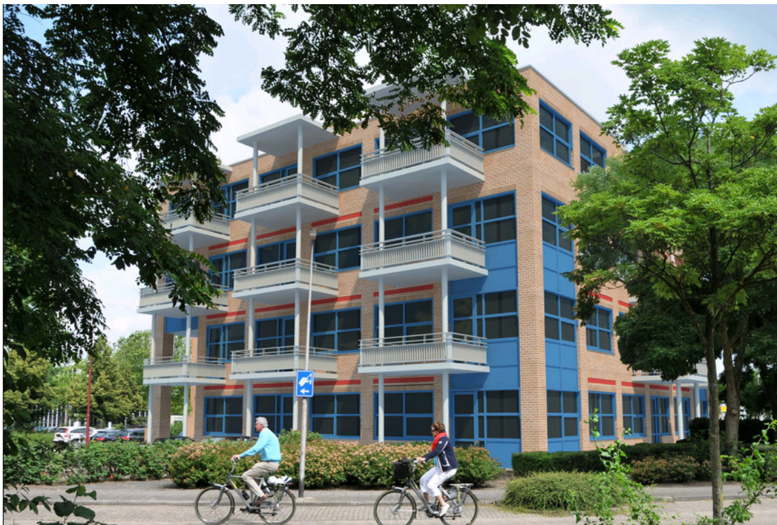
Nieuwegein: een kantoor omgetoverd tot kleinschalig appartementencomplex

De leegstand van kantoren is een omvangrijk probleem. Het Planbureau voor de Leefomgeving publiceerde begin 2014 dat ongeveer 17% van de kantoorruimte in Nederland leeg stond. In totaal gaat het om 8,5 miljoen m 2 en de leegstand zal in de komende jaren nog verder toenemen. Het rijk is samen met de markt intensief bezig om de transformatie van kantoren naar woonruimte te bevorderen. Onder meer is in 2012 door het ministerie van BZK en de VNG een Expertteam (Kantoor)transformatie ingesteld, dat gemeenten en eigenaren praktische ondersteuning biedt bij de transformatie van kantoren en sinds 2014 van ook maatschappelijk vastgoed in woonruimte. Inmiddels zijn in tal van gemeenten initiatieven ondersteund (zie bijgevoegde kaart). De geïnitieerde projecten hebben voor het merendeel betrekking op een definitieve transformatie van kantoren naar woonruimte, maar met de