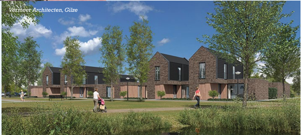
Vermeer Architecten, Gilze