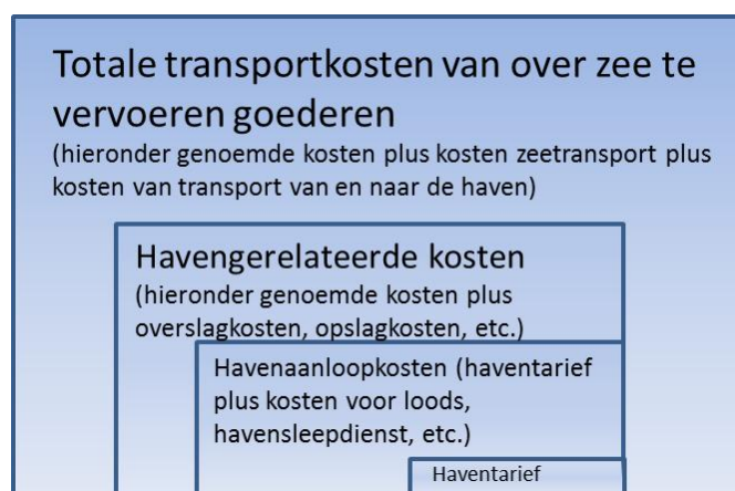
Figuur 6.1 Samenstelling totale transportkosten overzeese goederen

Haventarieven of havengelden maken echter maar een beperkt deel uit van de totale havengerelateerde kosten, zie onderstaande figuur. Haventarieven zijn de havengelden die geïnd worden door havenbeheerders voor het ter beschikking stellen van infrastructuur. Deze havengelden maken samen met bijvoorbeeld de kosten van loodsen en sleepdiensten deel uit van de havenaanloopkosten. De havenaanloopkosten vormen tezamen met de kosten voor cargobehandeling en -afhandeling (overslag) de totale havengerelateerde kosten. Deze havengerelateerde kosten vormen weer onderdeel van de totale transportkosten (de kosten voor het vervoer van goederen van herkomst naar bestemming).