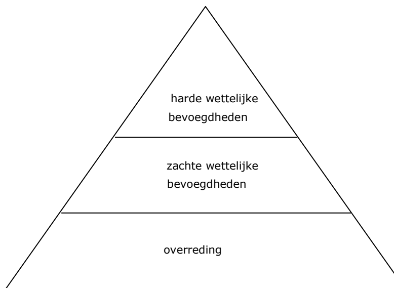
Figuur 2.4.a. Interventiepiramide

Een dergelijke toezichtvisie op de wijze waarop de minister van Financiën invulling geeft aan zijn systeemverantwoordelijkheid is in 2011 tot stand gekomen en wordt thans geëvalueerd: de visie Toezicht op Afstand . 37 In deze visie is onder meer de interventiepiramide uiteengezet, bestaande uit drie categorieën bevoegdheden die de minister van Financiën heeft in het kader van het toezicht op de AFM: overreding, zachte wettelijke bevoegdheden en harde wettelijke bevoegdheden.