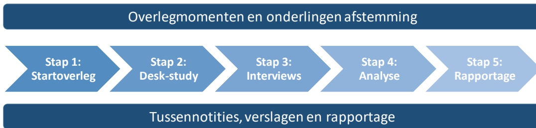
Figuur Stappenplan project “Evaluatie Tijdelijke subsidieregeling stimuleren bundeling van goederenstromen voor vervoer op het spoor

De resultaten van de evaluatie worden in het nu volgende hoofdstuk gepresenteerd.