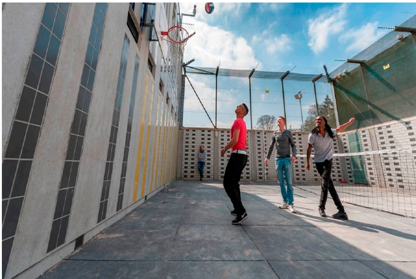
Afbeelding 16.

Binnen het terrein Jeugd is er een intensieve samenwerking tussen de verschillende toezichthouders in het jeugdveld en het sociaal domein. Naast de Inspectie Jeugdzorg en Inspectie voor de Gezondheidszorg werkt de Inspectie VenJ in het sociaal domein ook samen met de Inspectie Sociale Zaken en Werkgelegenheid en de Inspectie voor het Onderwijs. Deze vijf rijksinspecties werken samen onder de noemer Samenwerkend Toezicht Jeugd. Het toezicht richt zich op risico's, maar ook op calamiteiten. De Inspectie VenJ richt zich voornamelijk op instellingen waarmee jeugdigen via opgelegde justitiële maatregelen in aanraking komen. Dit zijn naast de justitiële jeugdinrichtingen ook de Raad voor de Kinderbescherming, de gecertificeerde instellingen voor onder andere jeugdreclassering en Halt.