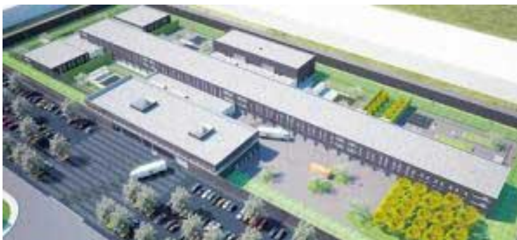
Afbeelding 1. Overzichtsfoto DCR

Het DCR is in 2010 gebouwd ten behoeve van vreemdelingenbewaring 7 . Het gebouw is echter zodanig ingericht dat verschillende doelgroepen en de wisselende vraag naar capaciteit binnen DJI opgevangen kunnen worden. Het DCR huisvestte in de