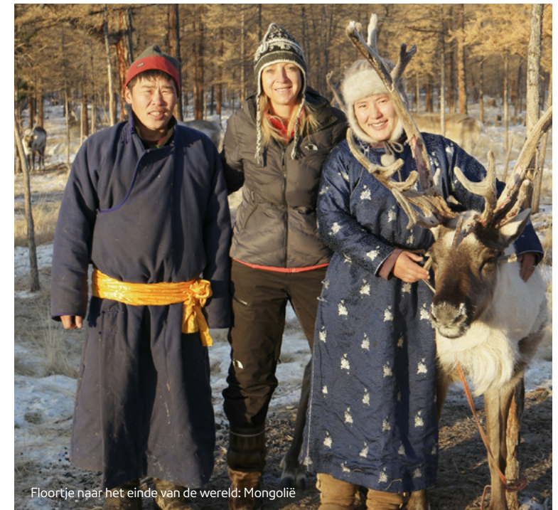
Floortje naar het einde van de wereld: Mongolië

In 2016 heeft de NPO voor het eerst gewerkt met het hierboven genoemde meetinstrumentarium. De komende jaren werken we aan een verdere invulling en verbetering ervan.