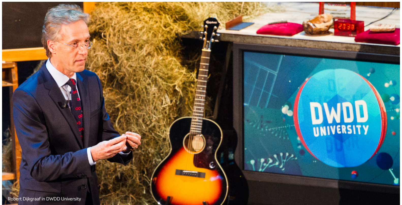
Robert Dijkgraaf in DWDD University

Om te kunnen meepraten, meedoen en meebeslissen hebben mensen kennis nodig. Ons aanbod bevatte ook in 2016 veel programma's in het domein Kennis, over uiteenlopende onderwerpen, van voeding tot