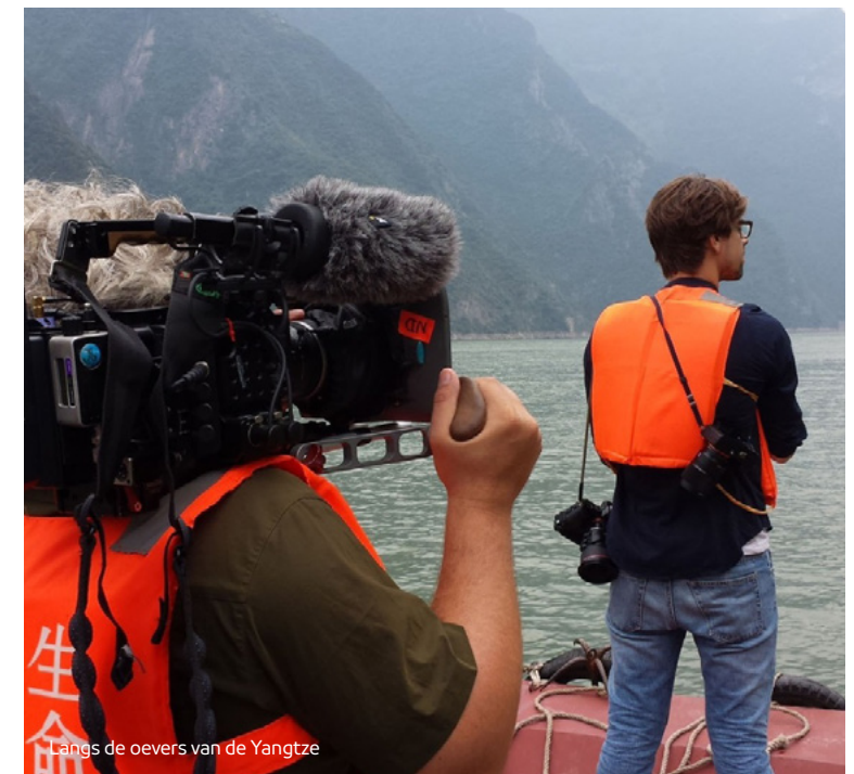
Langs de oevers van de Yangtze

Voor kinderen tussen 6 en 12 jaar biedt de NPO op Zapp dagelijks een sterk Nederlands aanbod aan kinderprogramma's, zoals Het Klokhuis (NTR) en het Jeugdjournaal (NOS). Ook zijn er speciaal voor kinderen gemaakte documentaires, series en films. Voor de jongere kinderen van twee tot en met vijf jaar is er de veilige omgeving van Zappelin, waar kinderen met programma's als Kindertijd (KRO-NCRV) en Het Zandkasteel (NTR) spelenderwijs kennis maken met de wereld om hen heen.