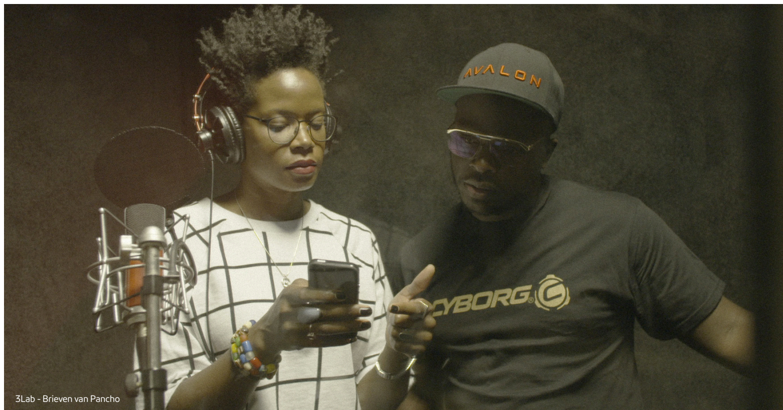
3Lab - Brieven van Pancho

speciale programma's, en al ons overige online aanbod. Om npo.nl een sterk, onafhankelijk en publiek domein te laten blijven, is regelmatige vernieuwing geboden. In 2016 hebben we ons vooral gericht op het makkelijker vindbaar maken van de lineaire livestreams in de navigatie. Dat betrof de vaste lineaire livestreams van de netten en zenders, inclusief de themakanalen, maar ook de tijdelijke livestreams rond het EK voetbal en de Olympische Zomerspelen.