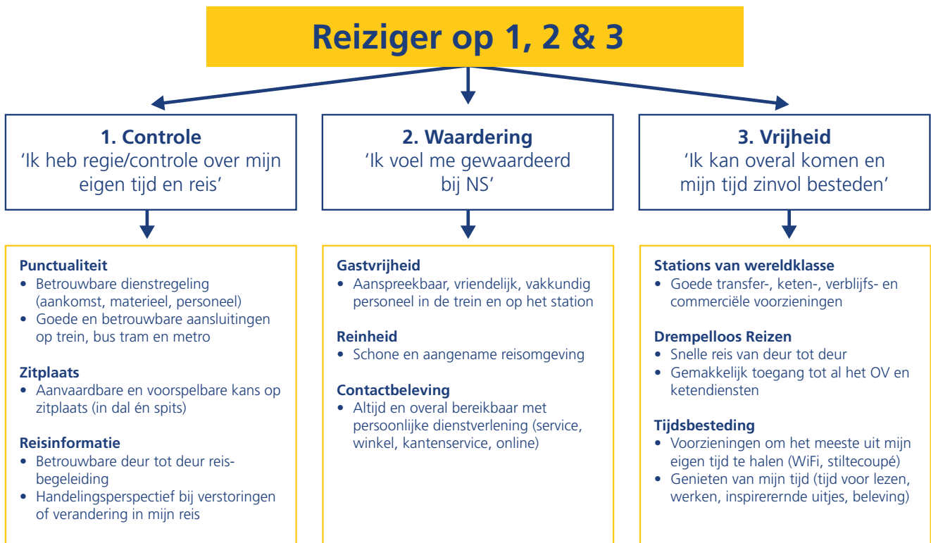
Figuur geeft de sturingsaanpak van NS op de klanttevredenheid weer.