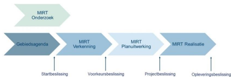
Figuur 2.1 Het MIRT-proces 13 .

Na besluitvorming wordt het voorkeursalternatief in de voorkeursbeslissing vastgelegd en vervolgens in een planuitwerkingsfase verder uitgewerkt om de realisatie voor te bereiden (figuur 2.1). De verkenningen die doorgaan naar de planuitwerking, eindigen met een politiek-bestuurlijk gedragen voorkeursoplossing. Deze voorkeursoplossing kan bestaan uit één voorkeursalternatief of uit een samenhangend en adaptief pakket van uiteenlopende acties op de korte en lange termijn.