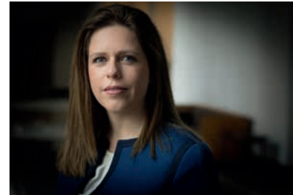
Carola Schouten minister van Landbouw, Natuur en Voedselkwaliteit

'Vertrouwen in de toekomst' is het motto van dit kabinet. Ik heb er veel vertrouwen in dat we toe kunnen werken naar kringlooplandbouw, en dat we daar samen met boeren, tuinders en vissers, andere ondernemers en maatschappelijke partijen onze weg in vinden.