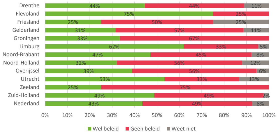
Figuur 3.3 Ministerie van BZK. Aandeel gemeenten naar wel of geen beleid per provincie (n=237)

Onderstaande figuur laat zien dat het aandeel van de gemeenten dat beleid heeft, behoorlijk varieert per provincie.