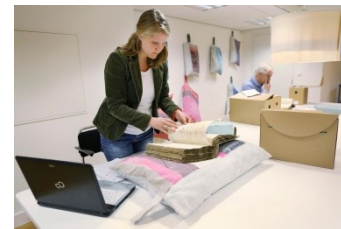
Onderzoekers werken aan de digitalisering van archiefstukken.

In het rapport ' De juiste papieren 2 ' heeft de Inspectie verslag gedaan van een onderzoek naar de organisatie, de kwaliteit en het wegwerken van de archiefachterstanden bij de ministeries. In dit rapport is aangegeven dat er ook achterstanden bestaan bij de Zelfstandige Bestuursorganen (ZBO's) en Publiekrechtelijke Beroepsorganisaties (PBO's). In 2018 is op basis van de resultaten uit de Monitor 2017-2018 een nadere analyse gemaakt van de omvang en de aard van de achterstanden bij ZBO's en PBO's.