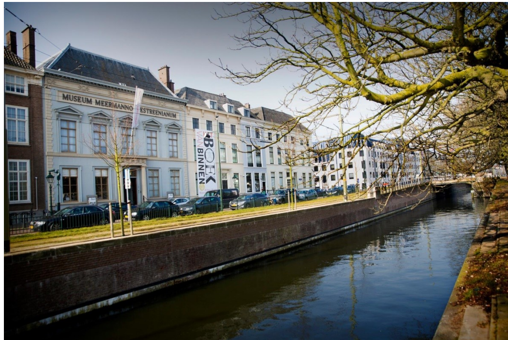
Zicht op de gevel en gracht van Museum Meermanno

De Inspectie heeft vanaf 2019 zijn naam aangepast mede naar aanleiding van deze ontwikkelingen. Het begrip informatie met al zijn verschijningsvormen heeft ook bij de overheid ingang gevonden. Met de aanduiding Inspectie Overheidsinformatie en Erfgoed verduidelijken we onze terreinen van toezicht.