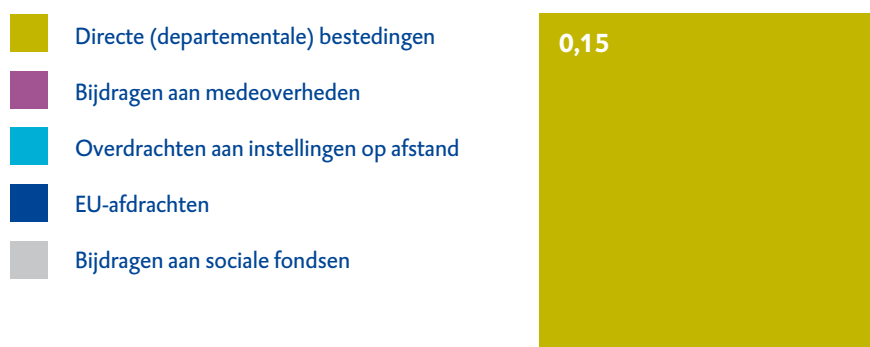
Figuur 1 Uitgaven Staten-Generaal in 2018