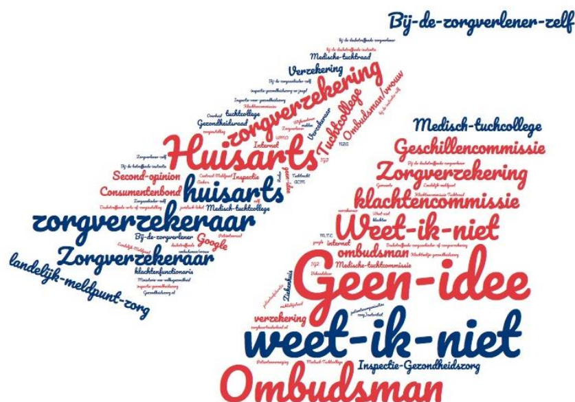
Figuur 3 Waar zou u terecht kunnen met een klacht over de gezondheidszorg?

Alle respondenten werden allereerst open bevraagd naar hun ideeën over bij wie zij terecht zouden kunnen met een klacht over de gezondheidszorg. Deze antwoorden staan weergegeven in figuur 3. Vervolgens werd deze vraag nogmaals gesteld, maar dan met verschillende antwoordcategorieën (tabel 28). Hoewel het antwoord ‘bij de zorgverlener zelf’ in beide gevallen veelvuldig voorkomt, is het bij de open bevraging (figuur 1) opvallend dat een groot deel van de respondenten aangeeft het niet te weten (antwoordcategorieën “geen idee” en “weet ik niet”).