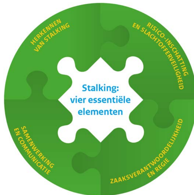
Figuur 1: De vier essentiële elementen van stalking.