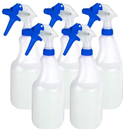
Figuur 2 Spuitflacons of triggersprays

De toegelaten gewasbeschermingsmiddelen voor particulieren zijn 'ready-to-use' oplossingen met 6% azijnzuur. De kant-en-klare producten zitten in een spuitflacon ('triggerspray'; zie Figuur 2). De dosering is 0,1 liter vloeistof per vierkante meter, dit komt overeen met 6 gram azijnzuur per m 2 . Bij pleksgewijze toepassing wordt aangenomen dat 10% van het oppervlak wordt behandeld en wordt daarom gerekend met een 10 maal lagere dosering (0,6 g/m 2 ). Oppervlakten mogen maximaal 4-6 keer per jaar worden behandeld waarbij er 14 dagen tijd moet zitten tussen de behandelingen.