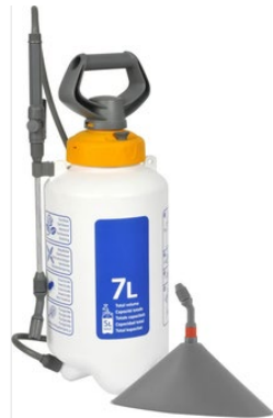
Figuur 3 Drukspuit met onkruidkap.

schoonmaakazijn met 9% azijnzuur in grote volumes aangeboden, maar ook azijnzuur in concentraties van 20 en 80%. Er worden ook combinatiepakketten aangeboden van jerrycans met azijnzuur en een drukspuit, al dan niet met onkruidkap (zie Figuur 3).