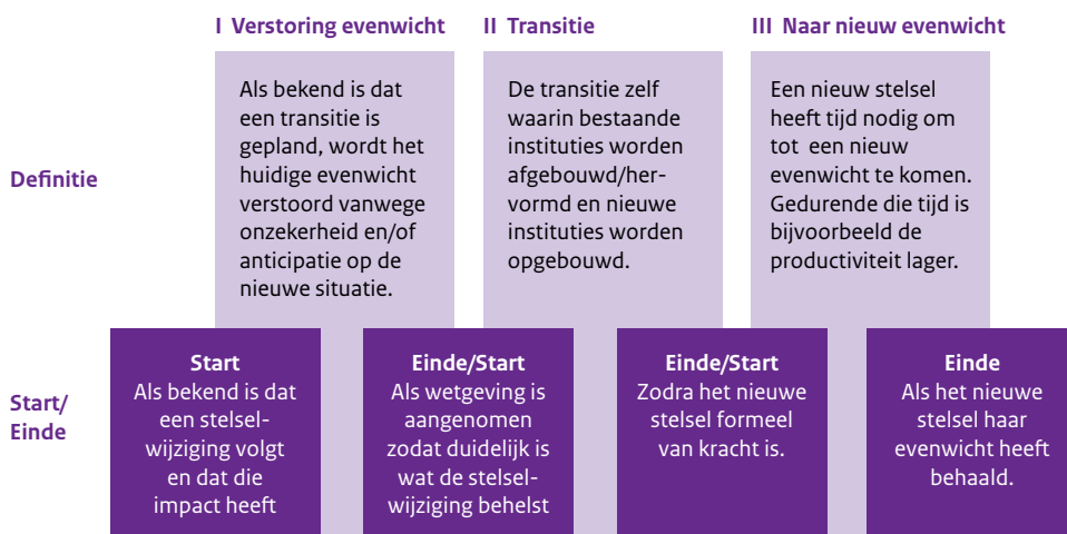
Figuur 1 Conceptueel kader van het transitieproces in de zorg

De drie fasen van het transitieproces gaan gepaard met verschillende typen transitiekosten voor de betrokken partijen (patiënten, zorgaanbieders, zorginkopers, gemeenten, rijksoverheid). Het conceptueel kader beschrijft vier typen van transitiekosten: