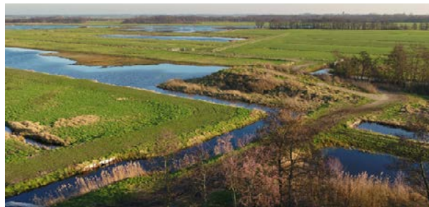
Recreanten welkom op uitzichtheuvel, midden in Natura 2000.

Daarnaast dachten op ons verzoek de Utrechtse waterschappen mee. Zij hebben hydrologische maatregelen voorgesteld, gericht op het optimaliseren van de inrichting en het versneld verbeteren van de (water)kwaliteit.