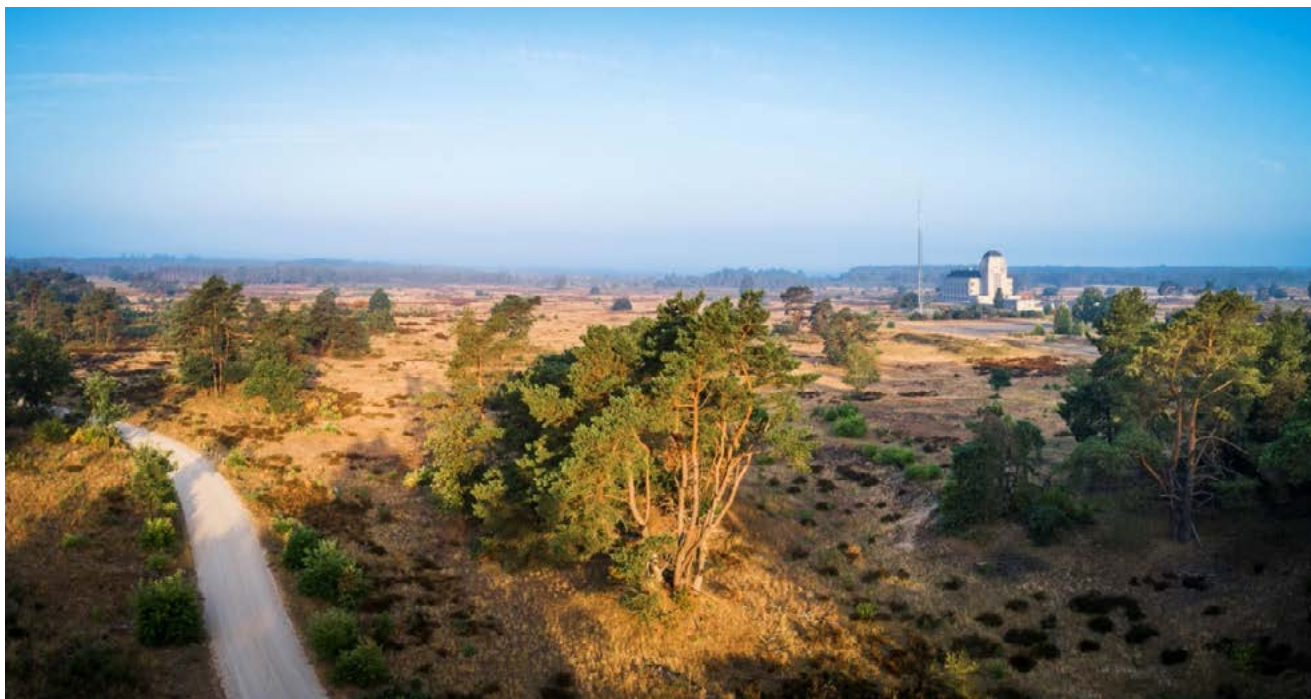
Radio Kootwijk: de grootste actieve zandverstuivingen van West-Europa.

Het Gelderse maatregelenpakket bestaat uit vijf onderdelen: 'natuurbeheer op orde', herstel van bestaande natuurgebieden, natuurinclusieve versterking in het agrarisch gebied rondom natuurgebieden, versterking natuurnetwerk in overgangsgebieden, en onderzoek, monitoring en evaluatie.