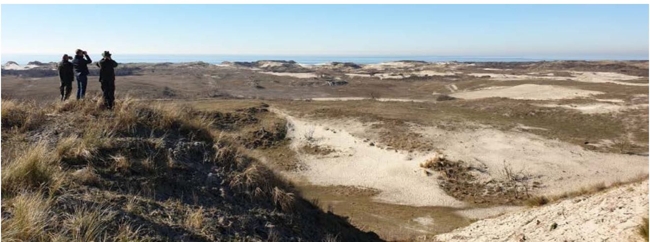
Herstelmaatregelen ter bevordering van de duindynamiek op de Kop van Schouwen.

De eerste drie jaar gebruiken we daarnaast ook om te monitoren en te bepalen welke maatregelen effectief zijn om vanaf 2023 op te nemen in onze Natura 2000-beheerplannen.