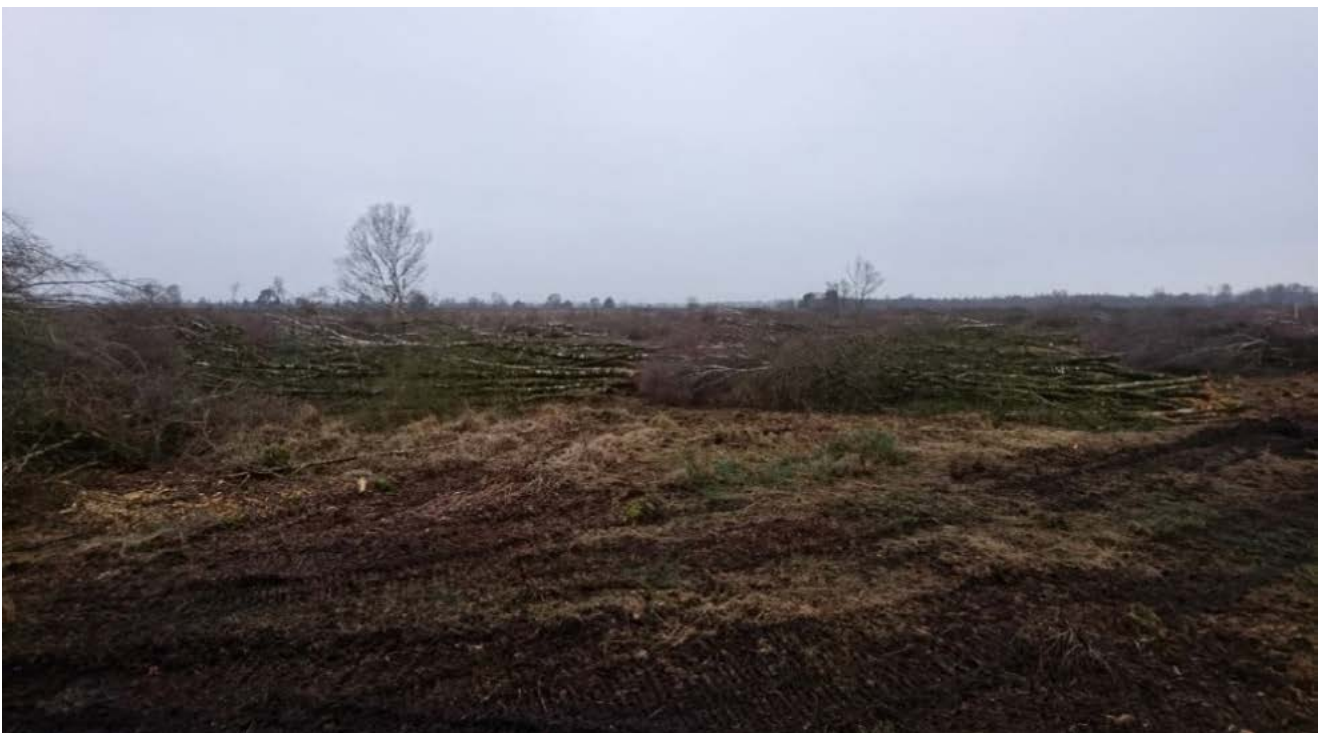
Boskap in Engbertsdijksvenen om uitdroging tegen te gaan.

Een ander belangrijk thema is bomenkap. In Overijssel is en wordt veel bos gekapt voor de instandhouding van specifieke stikstofgevoelige natuurtypen en zeldzame soorten. De komende tien jaar zal ter compensatie op grote schaal vervangend bos worden aangelegd. Ook daarbij gaan we samen aan de slag. Want 'samen werkt beter', ook voor het Programma Natuur!