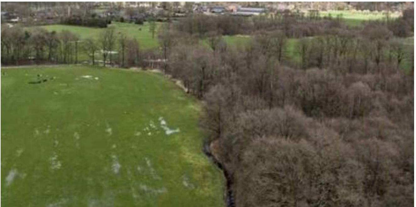
Natura 2000-gebied Leenderbos, Grootte Heide & De Plateaux.

Er moet in de komende tien jaar veel in en rondom de stikstofgevoelige Natura 2000-gebieden gebeuren. We kiezen voor een gebiedsgerichte aanpak waarin we naast natuurherstel zoveel mogelijk van deze andere opgaven meenemen. De afgelopen maanden zijn vergaande voorbereidingen getroffen, zodat we een snelle start kunnen maken. We zijn ervan overtuigd dat we het herstel van de natuur alleen kunnen bereiken als we de opgaven aan elkaar verbinden en daarbij nauw samenwerken met onze partners in het gebied. Zodat onze prachtige natuurgebieden in 2030 weer bruisen van het leven en de rijke biodiversiteit weer terugkeert.