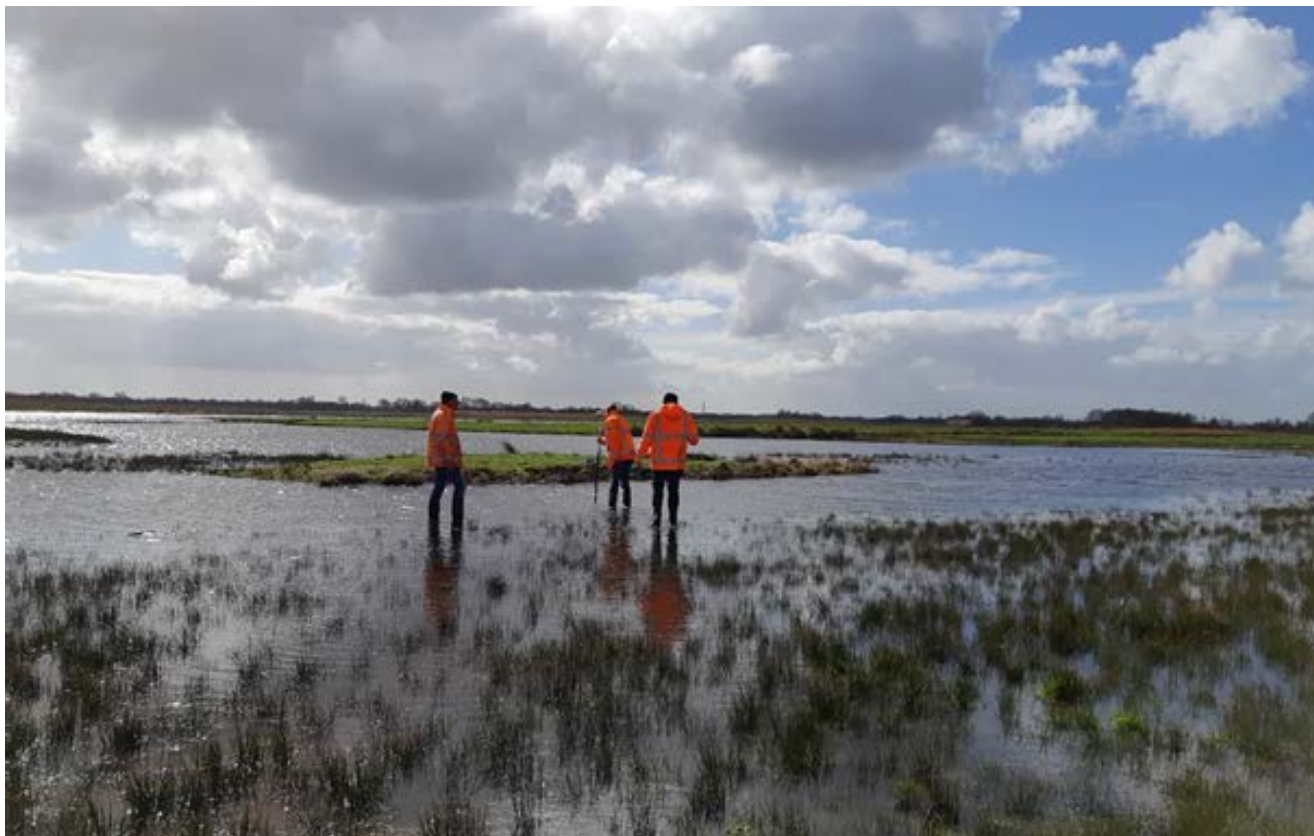
Potentieel blauw grasland met natuurlijk peil in de Oostelijke Vechtplassen.

Voor de langetermijnmaatregelen (drie tot en met tien jaar) gaan we nadere analyses uitvoeren. Deze leggen we vast in aangepaste Natura 2000-beheerplannen. Dit borgt het benodigde natuurherstel voor de lange termijn.