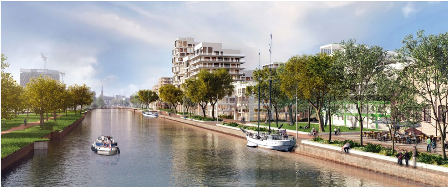
Toekomstige woningbouw in de stad Groningen: de nieuwe wijk Stadshavens, aan het Eemskanaal. Impressie: Gemeente Groningen

In zowel stad als regio zijn kwetsbare gebieden, in steden en dorpen. In die gebieden is sprake van een kwalitatief laagwaardige en energetisch slechte woningvoorraad en sleetse openbare ruimte. In de wijk- en dorpsvernieuwing worden deze opgaven reeds geadresseerd, waar mogelijk