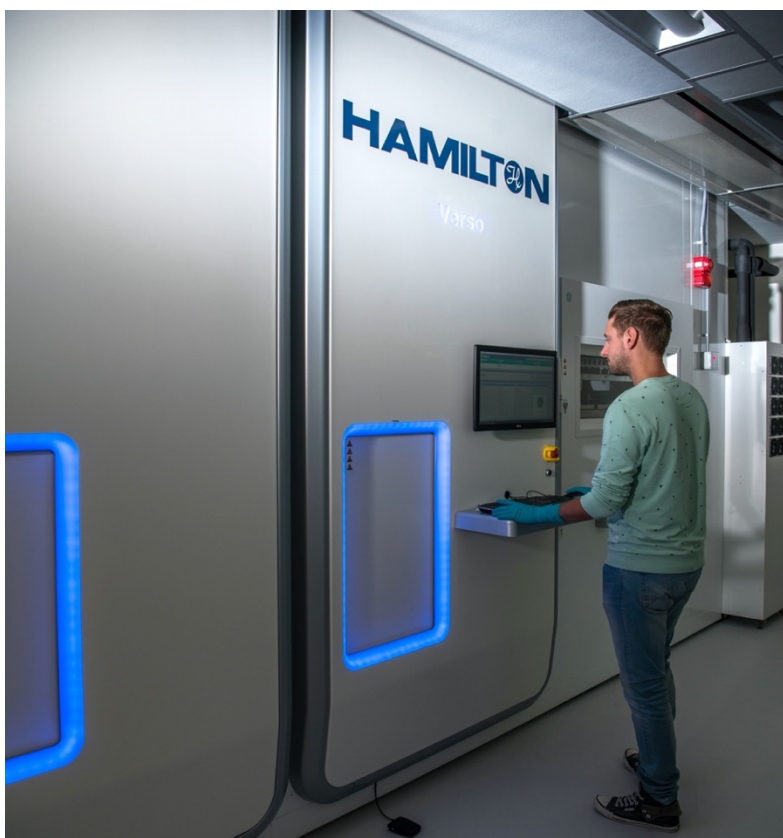
4 Opslagrobot Verso van NFI

Totaal: circa €617.000/jaar. Dit betreft een grove schatting. Hierbij is uitgegaan van het volume van scenario 4.1.a; voor het lagere volume van scenario 1.a zou het enkele procenten goedkoper kunnen zijn. De orde van grootte is hetzelfde.