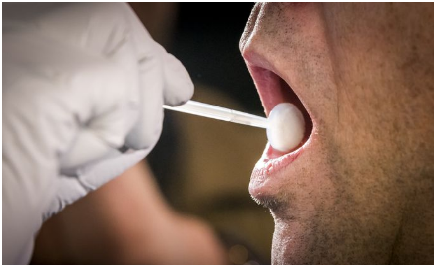
2 Afnemen van celmateriaal

De haalbaarheidsstudie kijkt naar de werkbaarheid van het werkproces. Daarbij worden de essentiële stappen van dat werkproces beschouwd, tot het detailniveau van bedrijfsproces. Dat is minder gedetailleerd dan het niveau van werkinstructie – maar voldoende voor het kunnen beantwoorden van de in hoofdstuk 2 weergegeven vragen, inclusief het maken van een grove inschatting van de hoeveelheid werk en de kosten.