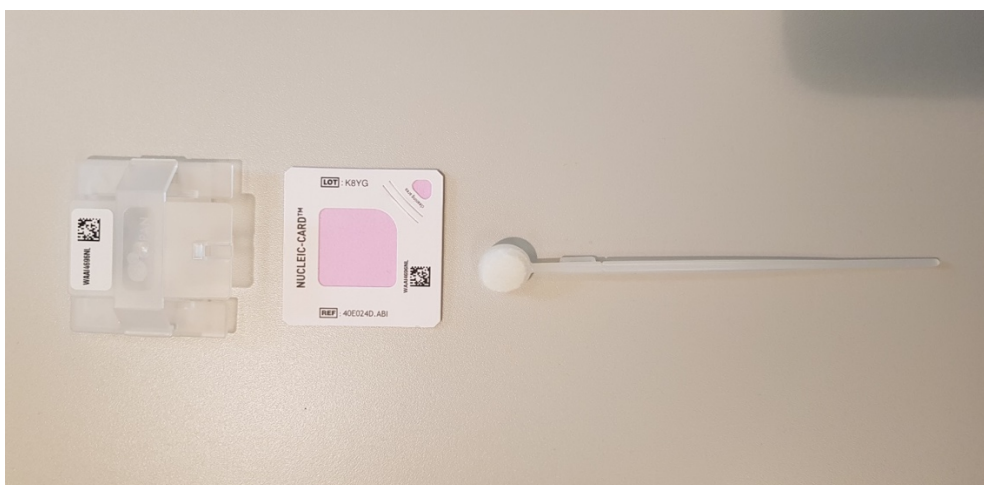
1 Afnamesponsje voor wangslim, met houder

IV Onderzoek wat de mogelijkheden zijn voor een robuuste ketenbrede ICT-ondersteuning van het werkproces, met geautomatiseerde berichtgeving in de strafrechtketen. Neem in acht wat de consequenties zijn voor de gegevensbescherming van de gevoelige en persoonsgebonden informatie die inherent aan het werkproces verwerkt moet worden. Sluit bij het onderzoek zoveel mogelijk aan bij al bestaande en operationele ICT-voorzieningen en geef een inschatting van hoeveel inspanning (kosten) en doorlooptijd de benodigde aanpassingen gaan kosten.