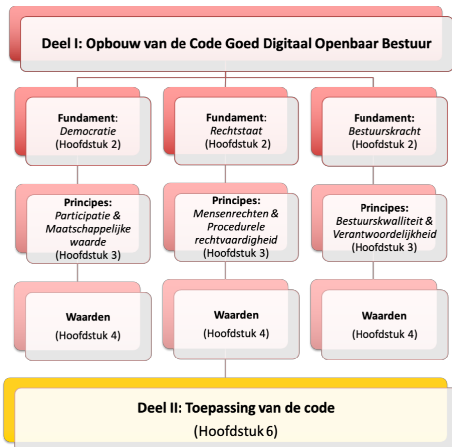
Figuur 1: Opbouw CODIO

Deze diverse codes zijn waardevol en leveren belangrijke inzichten op, maar wat opvalt aan deze codes is dat zij zich ofwel richten op een bepaald aspect van goed openbaar bestuur, bijvoorbeeld grondrechten, ofwel zich richten op een specifieke technologie. De Code Goed Digitaal Openbaar Bestuur richt zich op een breed scala aan technologieën en is ontwikkeld op basis van een academisch onderbouwde benadering van goed openbaar bestuur.