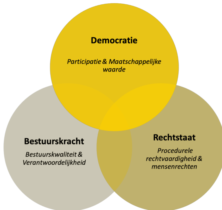
Figuur 2: Fundamenten en principes Code Goed Digitaal Openbaar Bestuur

Dit kader van fundamenten en principes vormt de stabiele basis voor de Code Goed Digitaal Openbaar Bestuur. Wij veronderstellen dat deze fundamenten en principes redelijk stabiel zijn en minder sterk onderhevig aan technologisch en maatschappelijke dynamiek. Binnen elk van deze zes principes kunnen verschillende waarden onderscheiden worden die wel sterker gerelateerd zijn technologische en maatschappelijke dynamieken. De nadruk op menselijke waardigheid en het recht op menselijk contact zijn bijvoorbeeld sterk verbonden aan het toenemend aantal interacties tussen burgers en digitale systemen. De waarden worden in het volgende hoofdstuk besproken.