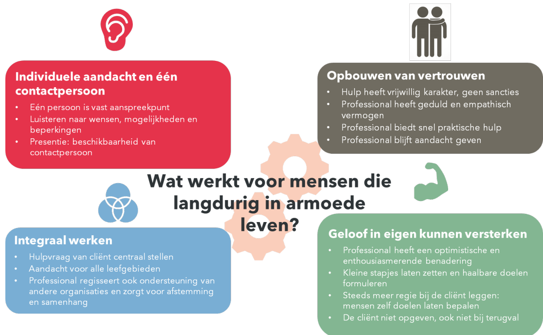
Figuur 1 Werkzame elementen van integrale aanpakken voor mensen die langdurig in armoede leven