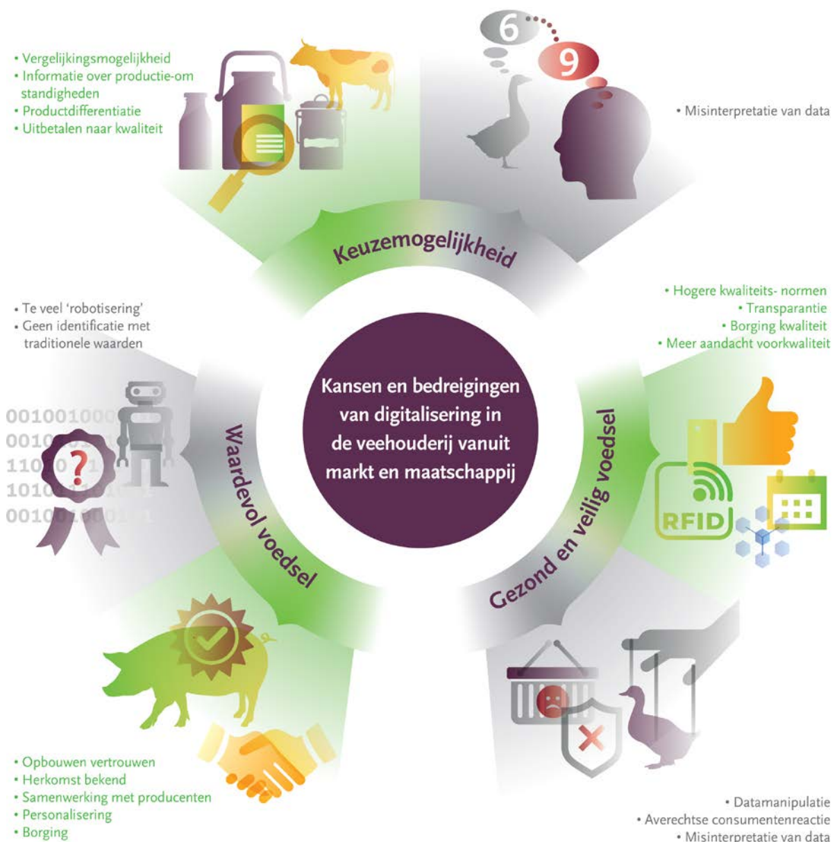
Figuur 3. Kansen en bedreigingen van digitalisering in de veehouderij vanuit markt en maatschappij.

Datamanipulatie vormt een bedreiging voor de gezondheid en veiligheid van ons voedsel. Het bewust zodanig doorgeven of beschikbaar stellen van data opdat een onjuist beeld wordt gegeven van de productieomstandigheden en/of de productkwaliteit en -samenstelling kan op vele manieren. Bijvoorbeeld door het benadrukken van goede aspecten van welzijn maar weglaten van negatieve aspecten op milieu. Waar in de stal hangen de sensoren die het klimaat meten, wat gebeurt er met een RFID-tag als een dier deze verliest, et cetera?