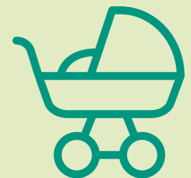
NA DE GEBORTE