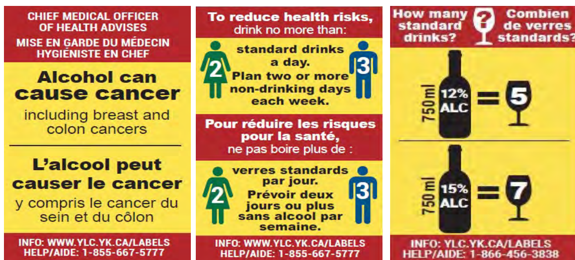
Figuur 5. Van links naar rechts productinformatie en gezondheidsinformatie en -waarschuwingen op etiketten van alcoholhoudende dranken in Canada over: 1) alcohol en kanker; 2) het Canadees drinkadvies: drink maximaal twee (vrouwen) of drie (mannen) glazen alcohol per dag en drink twee of meer dagen per week geen alcohol 3 ; 3) het aantal standaardglazen per verpakking.

Onderzoek naar de effecten van alcohol etikettering is voornamelijk uitgevoerd onder de algemene bevolking. Onderzoek onder specifieke (risico)groepen is beperkt.