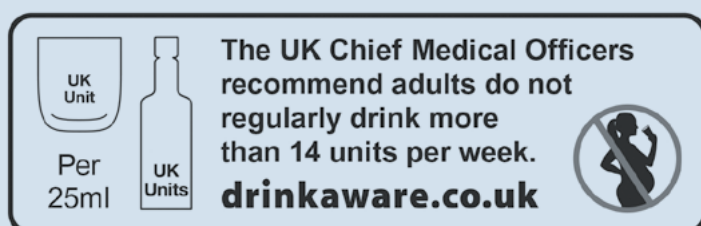
Figuur 4. Van links naar rechts een voorbeeld van productinformatie en gezondheidsinformatie en -waarschuwingen op etiketten van alcoholhoudende dranken in het Verenigd Koninkrijk over: het aantal standaardglazen per verpakking; het Britse drinkadvies; alcoholgebruik tijdens de zwangerschap.

De richtlijnen worden door de alcoholsector deels opgevolgd in het VK. Een studie vond dat op 78% van de alcoholhoudende dranken alle drie de onderdelen van etikettering vermeld stonden, maar dat in slechts 57% van de gevallen de daarvoor opgestelde richtlijnen werden opgevolgd. Zo werden gezondheidsinformatie en -waarschuwingen in tekst bijvoorbeeld kleiner getoond dan de richtlijnen voorschrijven en verscheen het zwangerschapspictogram kleiner op de verpakkingen van wijn dan op bier (Royal Society for Public Health, 2018).