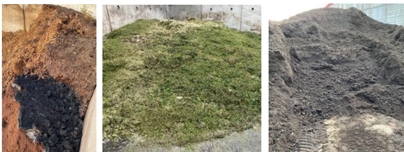
Figuur 16: A (links): Bollenafvalhoop, voordat het co-vergister (A) ingaat B (midden): Groentenaafval, voordat het co-vergister (A) ingaat C (rechts): Co-vergist materiaal (vergister A)