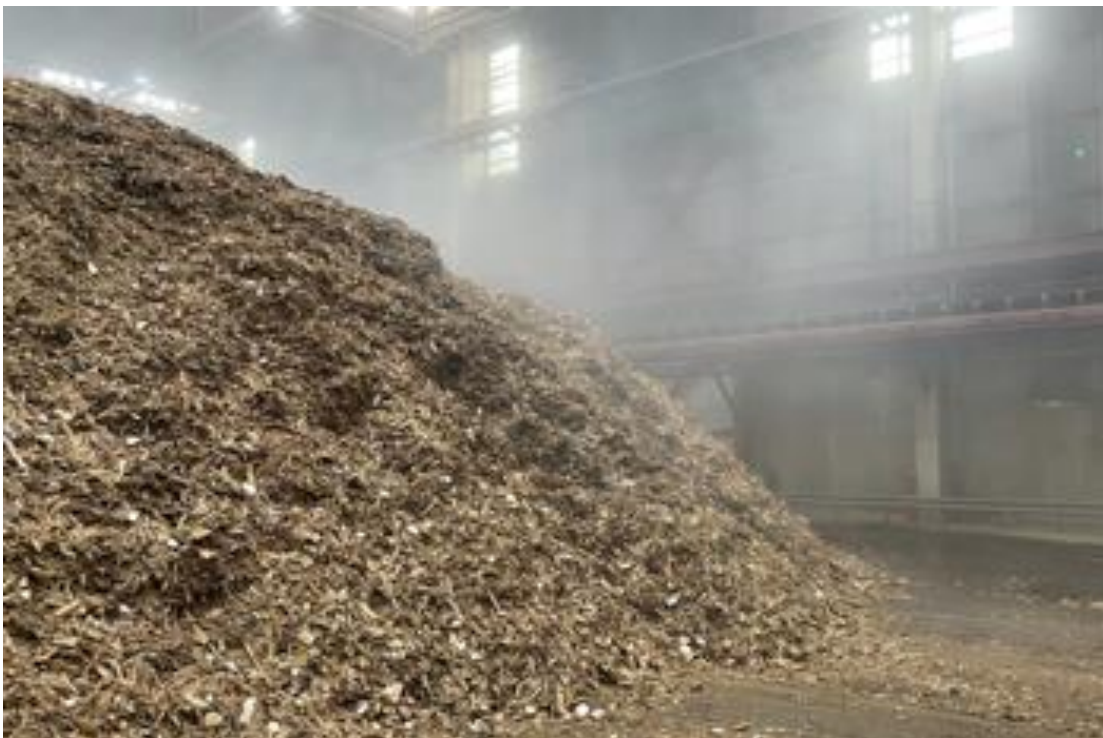
Figuur 5: Foto van categorie B-houtafvalhoop, met resistente Aspergillus , binnen, bij een energiecentrale

In één monster bij een energiecentrale is een hoog gehalte A. fumigatus aangetroffen met een resistentiepercentage van 19% (zie tabel 3.2 op de volgende pagina). Dit monster bestaat uit fijngemalen bouw- en slooafval, snoeihout en 1% GFT-afval (zie figuur 5 hieronder) en bevat naast propiconazool en tebuconazool ook azaconazool, prochloraz en imazalil. De eerste twee azolen worden zowel bij de houtbehandeling als bij de teelt van groente en fruit gebruikt. De andere drie worden alleen in (deels buitenlands geteelde) groene en fruit toegepast en zijn waarschijnlijk via de 1% GFT in de afvalhoop terecht gekomen.