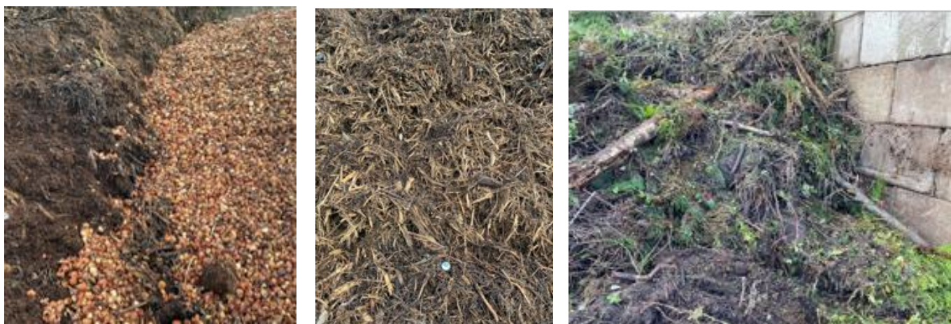
Figuur 14: A (links): Bollenafvalhoop, biomassawerf D, met resistente Aspergillus B (midden): Hoop versnipperd groenafval, biomassawerf D, met resistente Aspergillus C (rechts): Groenafvalhoop, biomassawerf D, met resistente Aspergillus

Het groenafval blijkt op alle vier de werven altijd Aspergillus fumigatus in hoge aantallen te bevatten. Ook de resistente variant (tabel 3.11). Op de drie locaties waar compostering plaatsvindt, zien we een sterke daling van de (resistente) A. fumigatus zodra de compostering enkele weken aan de gang is. In de monsters met een temperatuur van 62 en 65 °C is bijna geen resistente A. fumigatus aanwezig. Dit beeld is bekend van de eerdere onderzoeken bij biomassawerven (Van der Wal et al. 2014 en Verweij et al. 2017). Bij het monster met een temperatuur van 59 °C is nog wel A. fumigatus aanwezig en geen resistentie gevonden (tabel 3.11 op de volgende pagina).