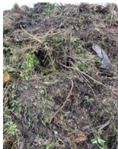
Figuur 13: Groenafval (mix) Biomassawerf B, resistente Aspergillus

Bij biomassawerf D -waar alleen tussenopslag plaatsvond en de uiteindelijke bestemming van het materiaal een andere biomassawerf was- waren de inputstromen fysiek gescheiden, zodat deze separaat bemonsterd konden worden. Het betrof bollenafval (figuur 14 hieronder, foto A), groenafval (versnipperd, 14B) en groenafval met vooral takken (14C).