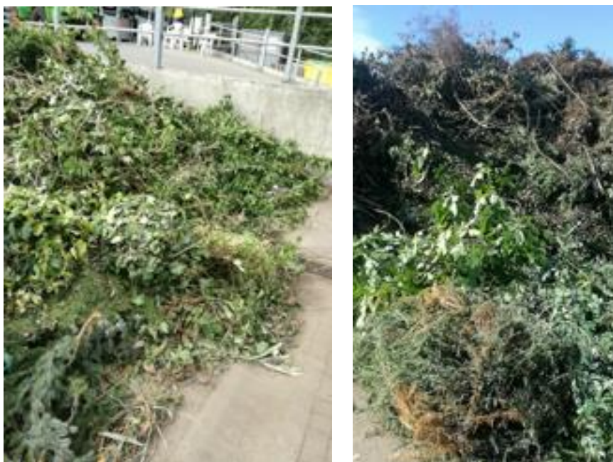
Figuur 10A en B: Groenafvalhopen, grof materiaal, met resistente Aspergillus op gemeentewerf

Groenafval op gemeentewerven bevatte in twee van de vier afvalhopen resistente Aspergillus fumigatus in relatief lage gehalten (figuur 10A en B hierboven en tabel 3.9 op de volgende pagina). In de monsters zijn geen detecteerbare gehalten azolen aangetroffen. De temperatuur in deze groenafvalhopen varieerde tussen 18 en 47 °C.