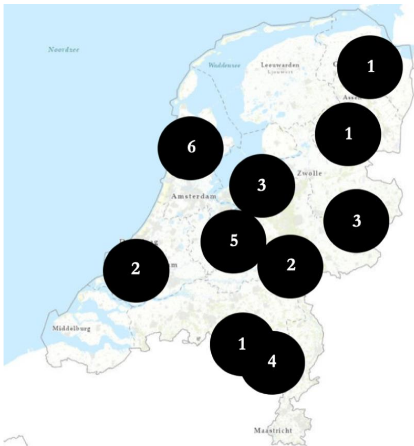
Figuur 1. Globale ligging van de 28 monsterlocaties in Nederland.