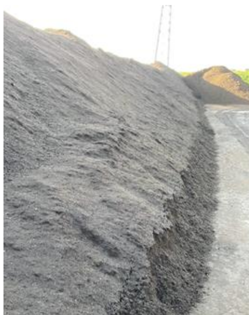
Figuur 15: Compost als eindproduct op de biomassa-werf; niet of nauwelijks resistente Aspergillus , temperatuur gedaald naar 31 °C.

In tabel 3.12 hieronder is het percentage monsters met een hoog (> 1000 CFU/g) gehalte resistente Aspergillus weergegeven. In groenafval op de biomassawerven is sprake van hoge resistentie in 63% van de monsters. Soms worden azolen aangetroffen. In het composteringsproces neemt het aantal resistente A. fumigatus sterk af.