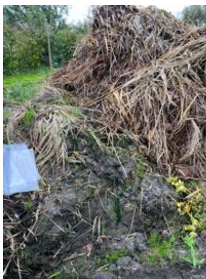
Figuur 6: A (links): Kleine opslag, van op de kant gelegd slootmaaisel, zonder Aspergillus B (rechts): Kleine opslaghoop van slootmaaisel, zonder Aspergillus