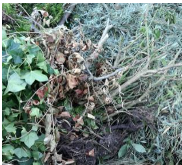
Figuur 11: Groenafvalhoop zonder resistente Aspergillus

In tabel 3.10 (op de volgende pagina) is het percentage monsters met een verhoogd (> 1000 CFU) gehalte resistente A. fumigatus weergegeven. In groenafval op de gemeentewerven is dit het geval in 33% van de monsters.