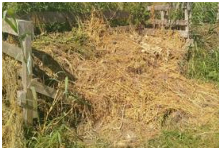
Figuur 7: A (links): Maaiselafvalhoop met beperkte aantallen resistente Aspergillus B (rechts): Maaiselafvalhoop met onkruid, met Aspergillus