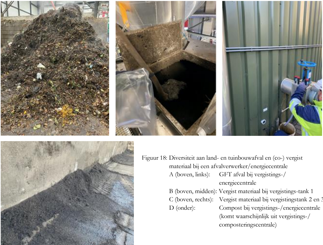
Figuur 18: Diversiteit aan land- en tuinbouwafval en (co-) vergist materiaal bij een afvalverwerker/energiecentrale A (boven, links): GFT afval bij vergistings-/energiecentrale B (boven, midden): Vergist materiaal bij vergistings-tank 1 C (boven, rechts): Vergist materiaal bij vergistingstank 2 en 3 D (onder): Compost bij vergistings-/energiecentrale (komt waarschijnlijk uit vergistings-/composteringscentrale)