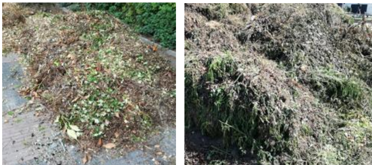
Figuur 9A en B: Kleine afvalhopen met hoge aantallen resistente Aspergillus

aantallen resistentie. In de uitgereden Bokashi is A. fumigatus aangetroffen en ook enige resistentie (1560 CFU/g). In eerder onderzoek (Schoustra et al. 2019a) is in een Bokashi -hoop geen resistentie aangetroffen. Dat is logisch omdat het proces van Bokashi-vorming anaeroob is en A. fumigatus zuurstof nodig heeft voor ontwikkeling en groei. In de huidige bemonstering lag de Bokashi echter al 21 dagen op het veld, zodat A. fumigatus zich alsnog kan ontwikkelen (na herbesmetting).