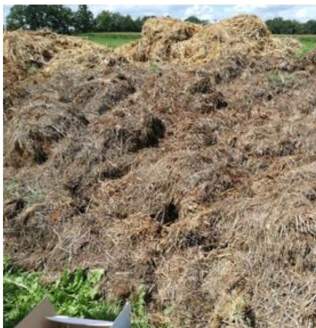
Figuur 8: Afvalhoop (compost) met gras, stro en land- en tuinbouwafval

De twee andere hopen bestaan uit divers groenafval (schoffel, snoei en maai-afval) (figuur 9A en B op de volgende pagina) en bevatten zeer hoge aantallen resistente A. fumigatus . De temperatuur in deze hopen varieerde tussen 31 en 65 °C 7 . De omstandigheden in deze hopen zijn gunstig voor A. fumigatus . Opvallend is dat in alle drie de gevallen sprake is van grote diversiteit van het materiaal. Er zijn geen azolen boven de detectiegrens aangetroffen. Vanwege de heterogene samenstelling (inclusief land- en tuinbouwafval), is het mogelijk dat plaatselijk in de hopen wel detecteerbare azolen voorkomen en/of dat de resistente A. fumigatus zich heeft verspreid door de hoop; of dat resistente sporen van A. fumigatus van elders zijn in ingewaaid en zich vervolgens hebben kunnen vermeerderen in het materiaal.