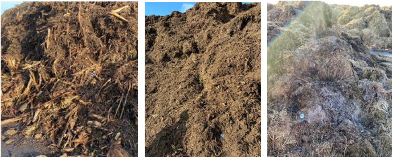
Figuur 12: A (links): Groenafvalhoop biomassawerf A, met resistente Aspergillus B (midden): Groenafval (versnipperd) biomassawerf C, met resistente Aspergillus C (rechts): Groenafval (maaisel) biomassawerf C, met resistente Aspergillus

Bij de biomassawerven zijn de aanwezige inputstromen zoveel mogelijk separaat bemonsterd. Bij biomassawerven A en C waren de inputstromen relatief homogeen (zie figuur 12 hieronder).