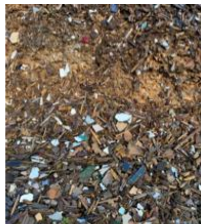
Figuur 3: Foto van categorie B-houtafval (semi-grof), zonder resistente Aspergillus , bij een energiecentrale

Het B-houtafval bij de energiecentrales 6 bevat in vier monsters wel Aspergillus fumigatus in lage gehalten, maar geen resistentie (tabel 3.1). De monsters zijn semi-grof en een mix van grove en fijnere stukken (figuur 3) en bevatten propiconazool en tebuzonazool.