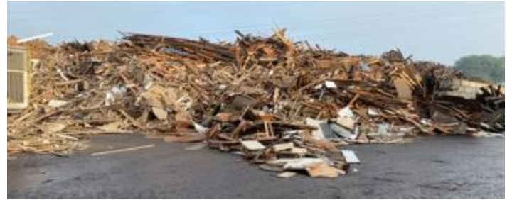
Figuur 4 (A, rechts): Foto van semi-grof/fijn categorie B-houtafval, met resistente Aspergillus , op een biomassawerf (B, links): Foto van grof categorie B-houtafval, zonder resistente Aspergillus , op een biomassawerf

In één monster bij een energiecentrale is een hoog gehalte A. fumigatus aangetroffen met een resistentiepercentage van 19% (zie tabel 3.2 op de volgende pagina). Dit monster bestaat uit fijngemalen bouw- en slooafval, snoeihout en 1% GFT-afval (zie figuur 5 hieronder) en bevat naast propiconazool en tebuconazool ook azaconazool, prochloraz en imazalil. De eerste twee azolen worden zowel bij de houtbehandeling als bij de teelt van groente en fruit gebruikt. De andere drie worden alleen in (deels buitenlands geteelde) groene en fruit toegepast en zijn waarschijnlijk via de 1% GFT in de afvalhoop terecht gekomen.