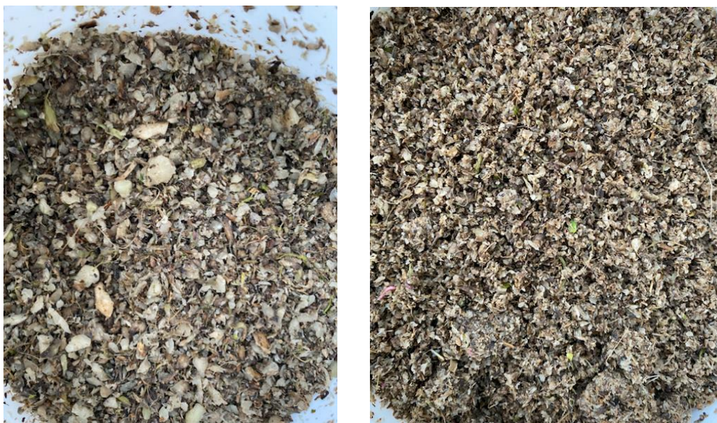
Figuur 8: Grovere (foto links) en fijnere (foto rechts) bietenpunten die opgeslagen liggen bij de verwerker