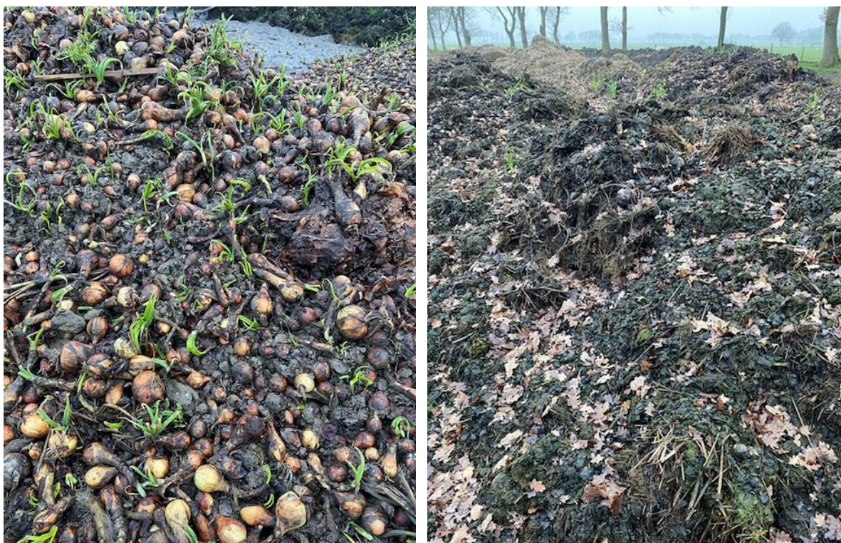
Figuur 3: Foto links: uienafval met een ligduur van 35 dagen bij een akkerbouwer (resistente A. fumigatus ) Foto rechts: uienafval met een ligduur van meer dan een jaar bij een akkerbouwer (resistente A. fumigatus )

Het uienafval met rotte uien bevat zowel azolen als hoge aantallen A. fumigatus (zie tabel 2 hierboven). Met name het afval dat meer dan een jaar op een landbouwperceel van een akkerbouwer ligt, (figuur 3 hieronder, foto rechts), bevat zeer hoge aantallen (> 8 miljoen CFU/g) en een hoog percentage resistentie. De aantallen in de rotte uien die een maand liggen bij de teler (figuur 3, foto links) zijn lager, maar ook nog steeds aanzienlijk.