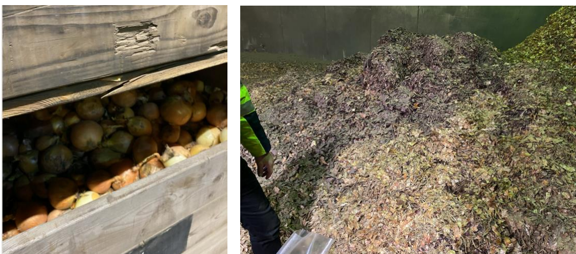
Figuur 2: Foto links: uitgeselecteerde uien met beschadiging bij een verwerker (geen A. fumigatus ) Foto rechts: uienpulp bij een verwerker (enige A. fumigatus )

Het monster van afgekeurde uien (foto links, figuur 2 hieronder) bevat geen resistente A. fumigatus en geen azolen (zie ook tabel 2 op de volgende pagina.). De uienpulp bij de verwerker (foto rechts, figuur 2 hieronder) bevat een beperkt gehalte aan resistente A. fumigatus en azolen (zie ook tabel 2 op de volgende pagina). De pulp bevat azolen en heeft een ligduur van maximaal 7 dagen.