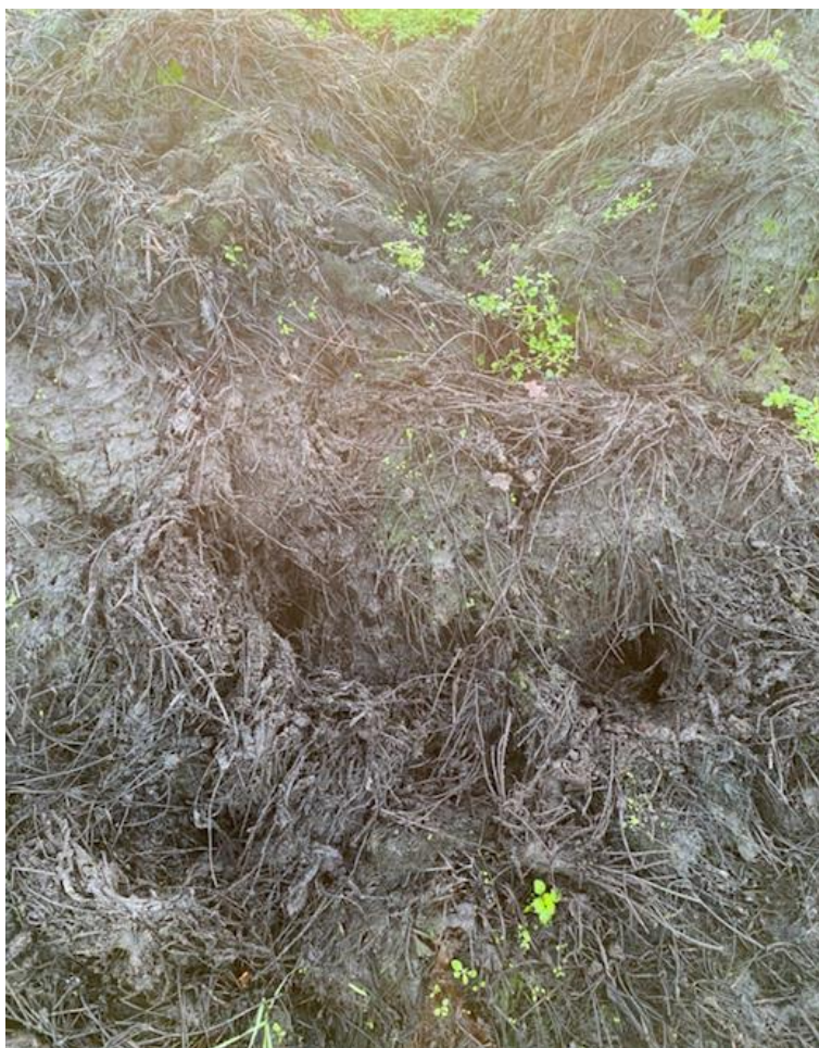
Figuur 10: Aardbeienafval dat 120 dagen buiten ligt bij een aardbeiplantenkweker