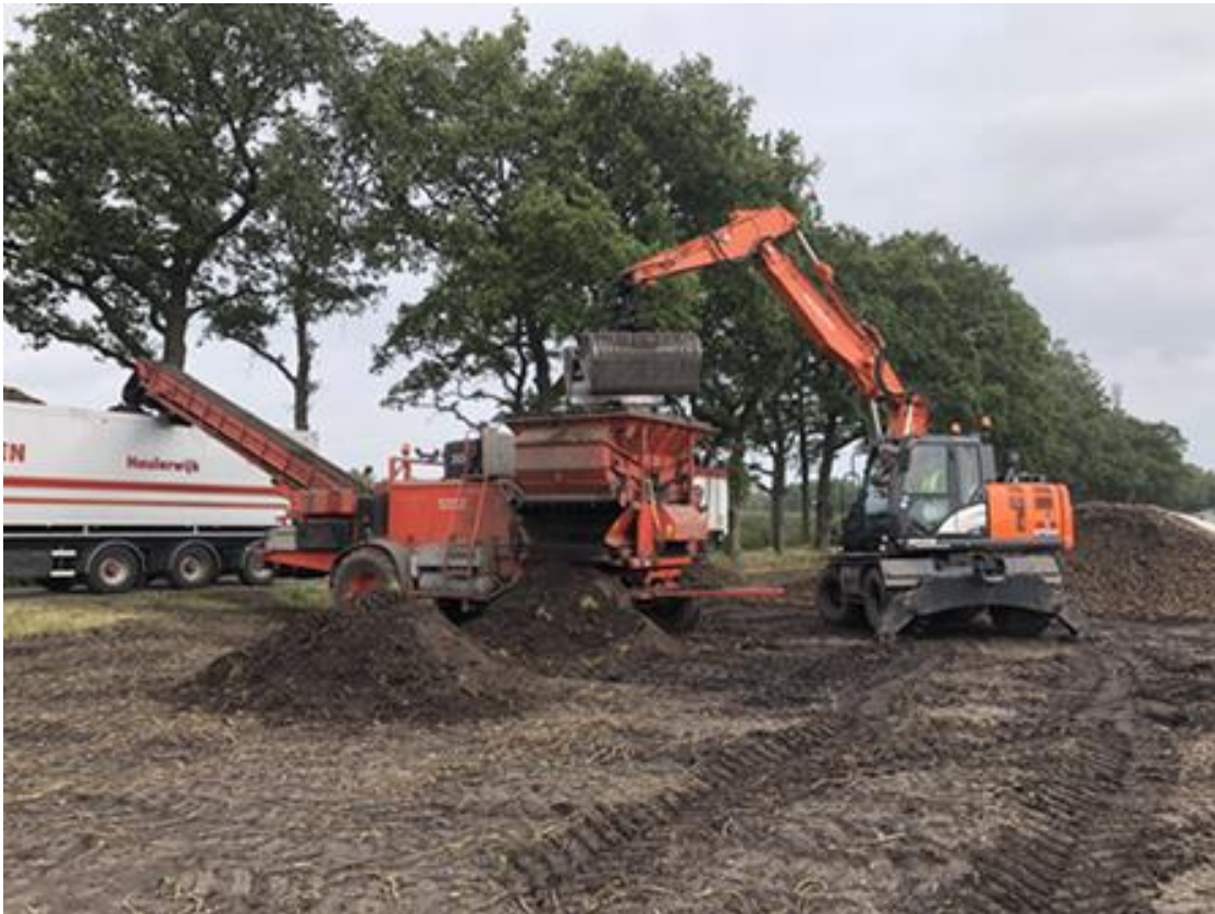
Figuur 1: Laden en schonen van zetmeelaardappelen

Bij het laden van zetmeelaardappelen op het land gaan de aardappels door een schoner of reinigingsmachine (zie figuur 1 op de volgende pagina). Het afgescheiden materiaal komt op een hoop te liggen, die voornamelijk bestaat uit rond met loof en (gekneusde) aardappels. Deze hopen worden niet afgedekt. Sommige telers verspreiden de hoop direct over de kopakker en andere laten deze tot na de winter liggen. Een enkele teler rijdt de bulten op een hoop en dekt deze af.