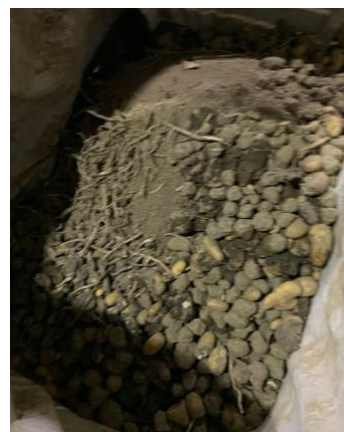
Figuur 4: Bij een verwerker binnen opgeslagen aardappelafval

Ook de monsters van aardappelafval dat tussen 60 en 75 dagen buiten lag (figuur 5, hieronder, foto's links, midden en rechts) bevatten nauwelijks (resistente) A. fumigatus , in twee gevallen wel azolen en in één geval (bij de biologische teler) geen azolen.