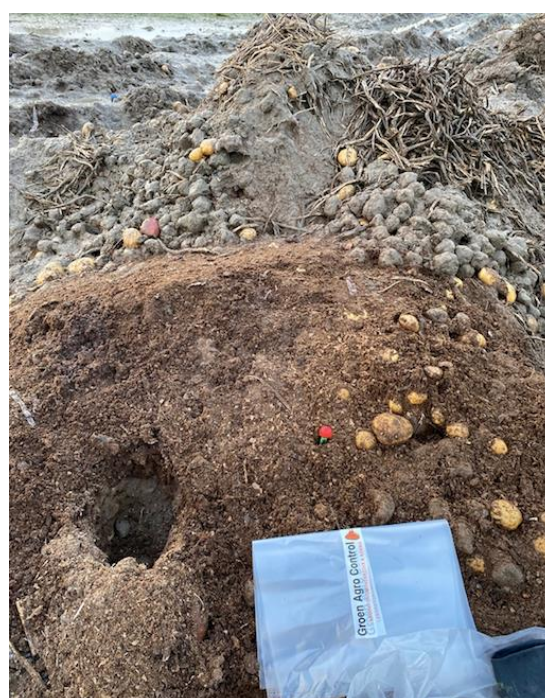
Figuur 6: Aardappelafval dat 90 dagen bij een verwerker buiten heeft gelegen

Opmerkelijk is dat de monsters van aardappelafval dat 90 dagen buiten lag bij een verwerker (figuur 6 hiernaast) wel hoge aantallen resistentie bevatten. Het bemonsterde materiaal was atypisch, in vergelijking met het andere aangetroffen materiaal: veel fijner qua structuur, zie voorgrond op de foto. Deze monsters bevatten ook azolen (zie ook tabel 3 op de volgende pagina). Deze monsters bevatten sowieso hoge aantallen A. fumigatus , in tegenstelling tot de andere monsters van aardappelafval.