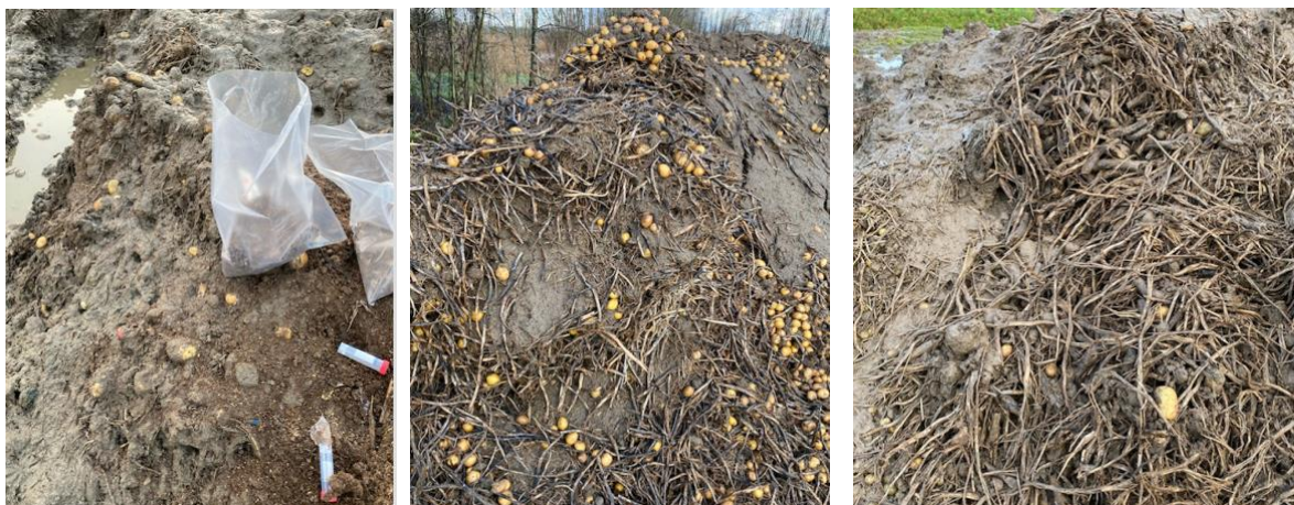
Figuur 5 Bij een verwerker buiten opgeslagen aardappelafval.

Foto links en midden: 2 maanden, foto rechts: 2,5 maand