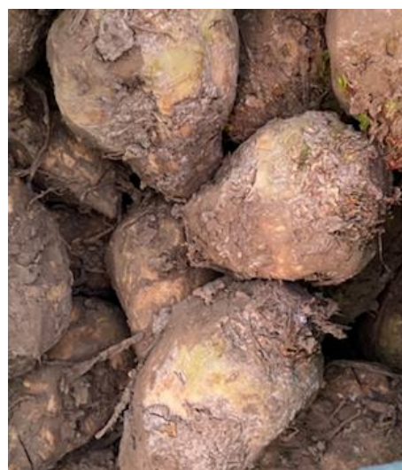
Figuur 7: Suikerbieten die 30 dagen buiten liggen bij een akkerbouwer

De monsters van suikerbieten die op een akkerbouwbedrijf waren opgeslagen, voordat transport naar de fabriek plaats-vond, bevatten nauwelijks resistente A. fumigatus en geen azolen (zie tabel 5.3 op de volgende pagina). Deze suikerbieten staan op de foto (figuur 7 hiernaast).