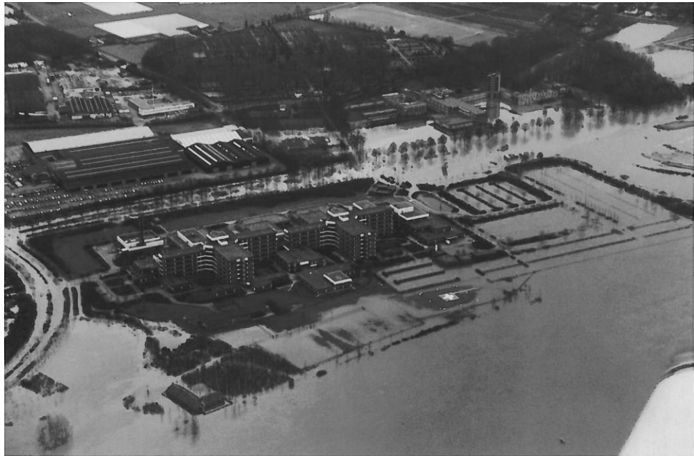
Figuur 2 Het Venlose St. Maartens Gasthuis (thans VieCuri MC) helemaal omsloten door het Maaswater (Bron: Kerst in het Water, Watersnoodramp 1993, Dagblad voor Noord-Limburg).

Na de overstroming in 1995 is een dijk aangelegd, die het ziekenhuisterrein afgrenst van de Maas. In de zomer van 2009 ontstond opnieuw wateroverlast, dit keer als gevolg van kortstondige, extreem hevige regenval. Het gevolg was dat: