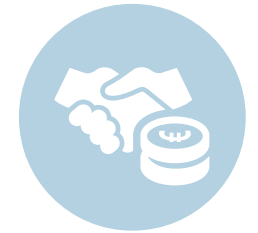
Een sterkere economie, sociale rechtvaardigheid en werkgelegenheid