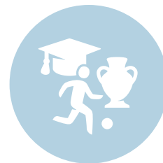
Onderwijs, cultuur, jeugdzaken en sport