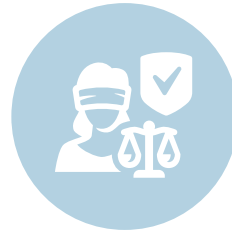
Waarden en rechten, rechtsstaat en veiligheid