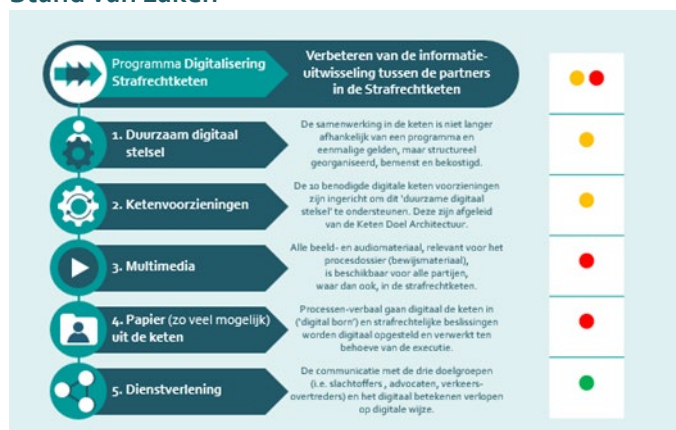
Stand van zaken van de vijf digitaliseringsdoelen

Voor het digitaliseringstraject heeft het programma 5 doelstellingen vastgesteld waarvan de status in bovenstaande tabel wordt weergegeven. De doelstelling op het gebied van dienstverlening aan de burger is tijdig bereikt. De andere doelstellingen zullen, zoals uit het voorgaande blijkt, de komende jaren worden gerealiseerd. De 'overall' status van het digitaliseringstraject wordt gekwalificeerd als "oranje/rood".