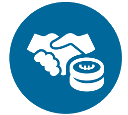
Een sterkere economie, sociale rechtvaardigheid en werkgelegenheid