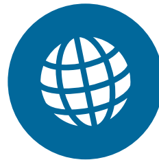
Rol van de EU in de wereld