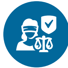
Waarden en rechten, rechtsstaat en veiligheid