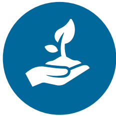
Klimaatverandering en milieu