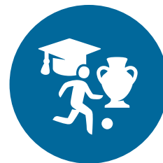
Onderwijs, cultuur, jeugdzaken en sport