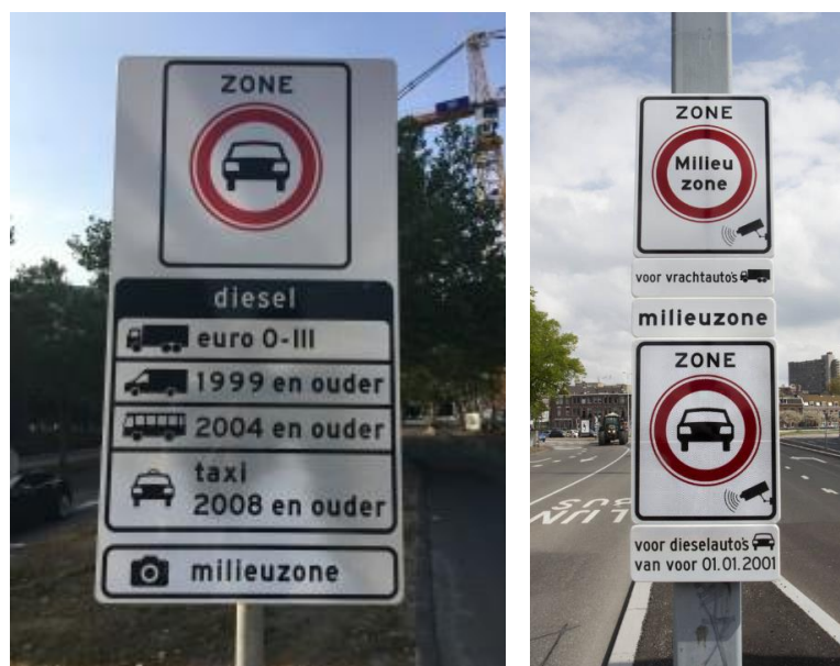
Figuur 1: Verkeersbord C6 en bijbehorende onderborden in Amsterdam (l) en Utrecht (r) vóór de harmonisatie

In 2006 is door gemeenten, bedrijfsleven en Rijk het “Convenant stimulering schone vrachtauto's en milieuzonering” ondertekend. In dit convenant zijn onder meer afspraken gemaakt over de milieueisen voor vrachtauto's in milieuzones, hantering van eenzelfde verkeersbord en regels voor ontheffingen. Naast milieuzones voor vrachtauto's zijn door verscheidene gemeenten de afgelopen jaren ook milieuzones ingesteld voor personen- en bedrijfsauto's 6 en/of autobussen. Deze gemeenten gebruikten voor de aanduiding van de milieuzone een ander verkeersbord (C6, gesloten voor motorvoertuigen op meer dan twee wielen) in combinatie met onderborden. Op deze onderborden werden de voertuigcategorie en het toegangsregime aangegeven. Consequentie was dat gemeenten verschillende toegangsregimes en verkeersborden hanteerden voor hun milieuzone.