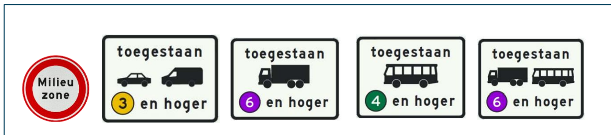
Figuur 2: Verkeersbord C22a met verschillende bijbehorende onderborden op basis van gespecificeerd toegangsregime

In het gewijzigde RVV is vastgelegd om voor alle milieuzones het verkeersbord C22a met specifieke onderborden te gaan hanteren.