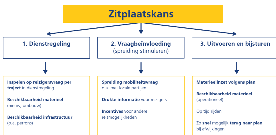
Figuur 2: Drie terreinen waarop NS de zitplaatskans verhoogt.

NS neemt op drie terreinen maatregelen om de zitplaatskans te verhogen: