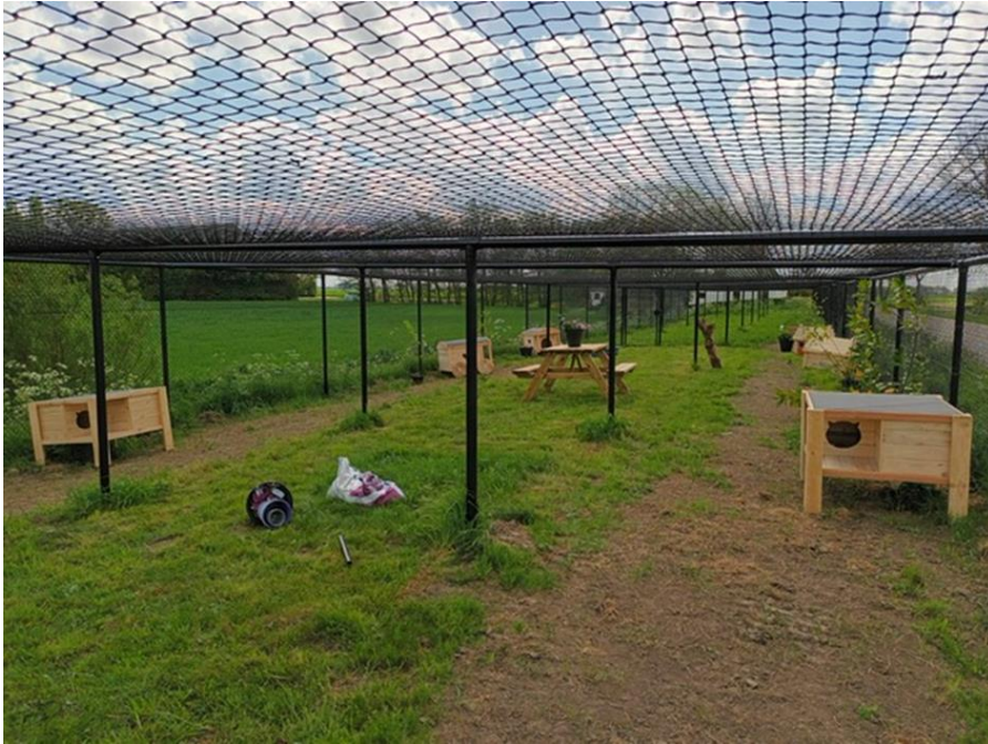
Figuur 3: Foto-impressie van kattenren in Friesland