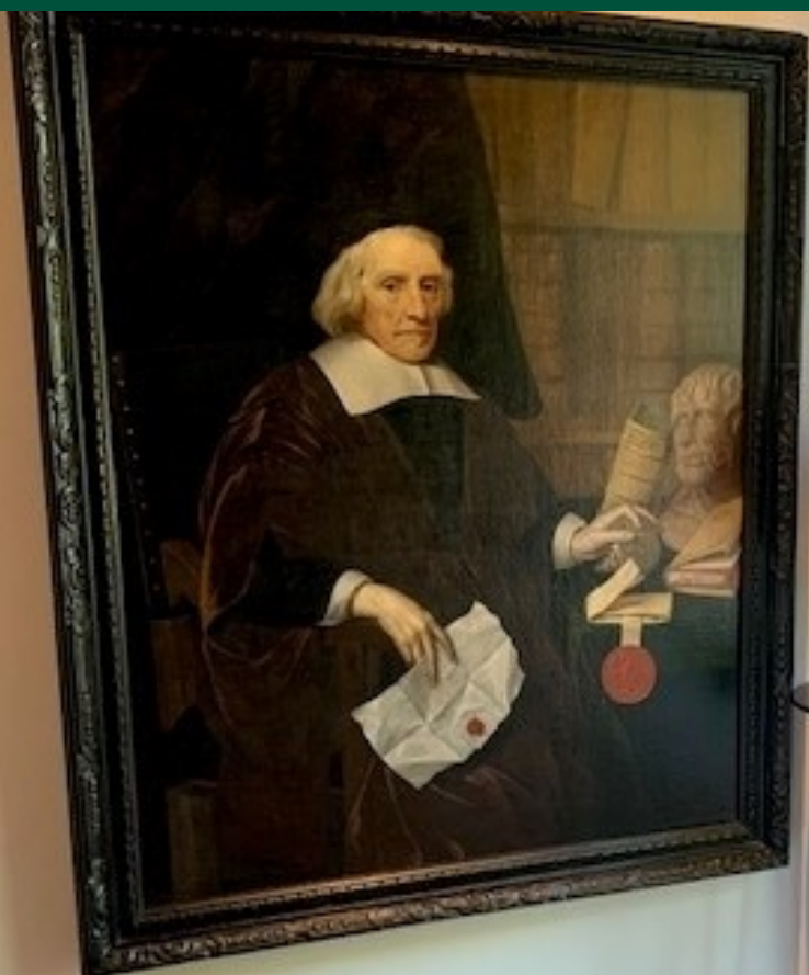
Afbeelding 3 Een schilderij uit de rijkscollectie in beheer van het ministerie van Algemene Zaken. Afgebeeld is Jacob Cats.