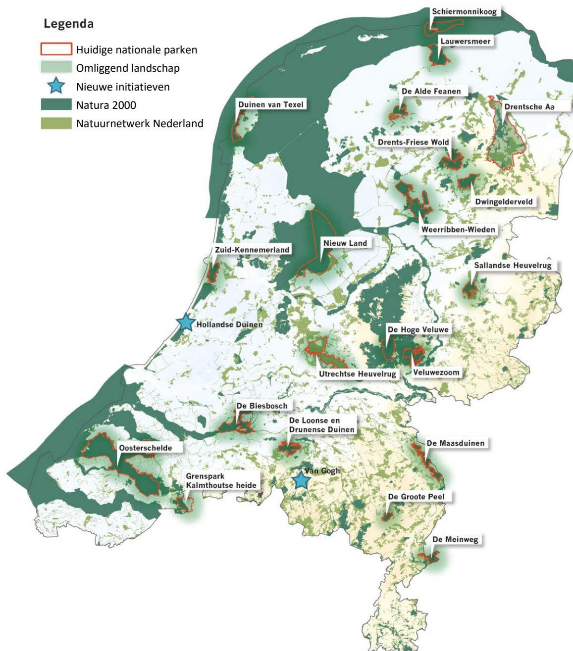
Figuur 1. De nationale parken op kaart: 21 bestaande parken en 2 initiatieven die een statusaanvraag hebben ingediend 5 . Op deze kaart is voor Nationaal Park Drentsche Aa de aangevraagde begrenzing aangegeven (zie pagina 18).