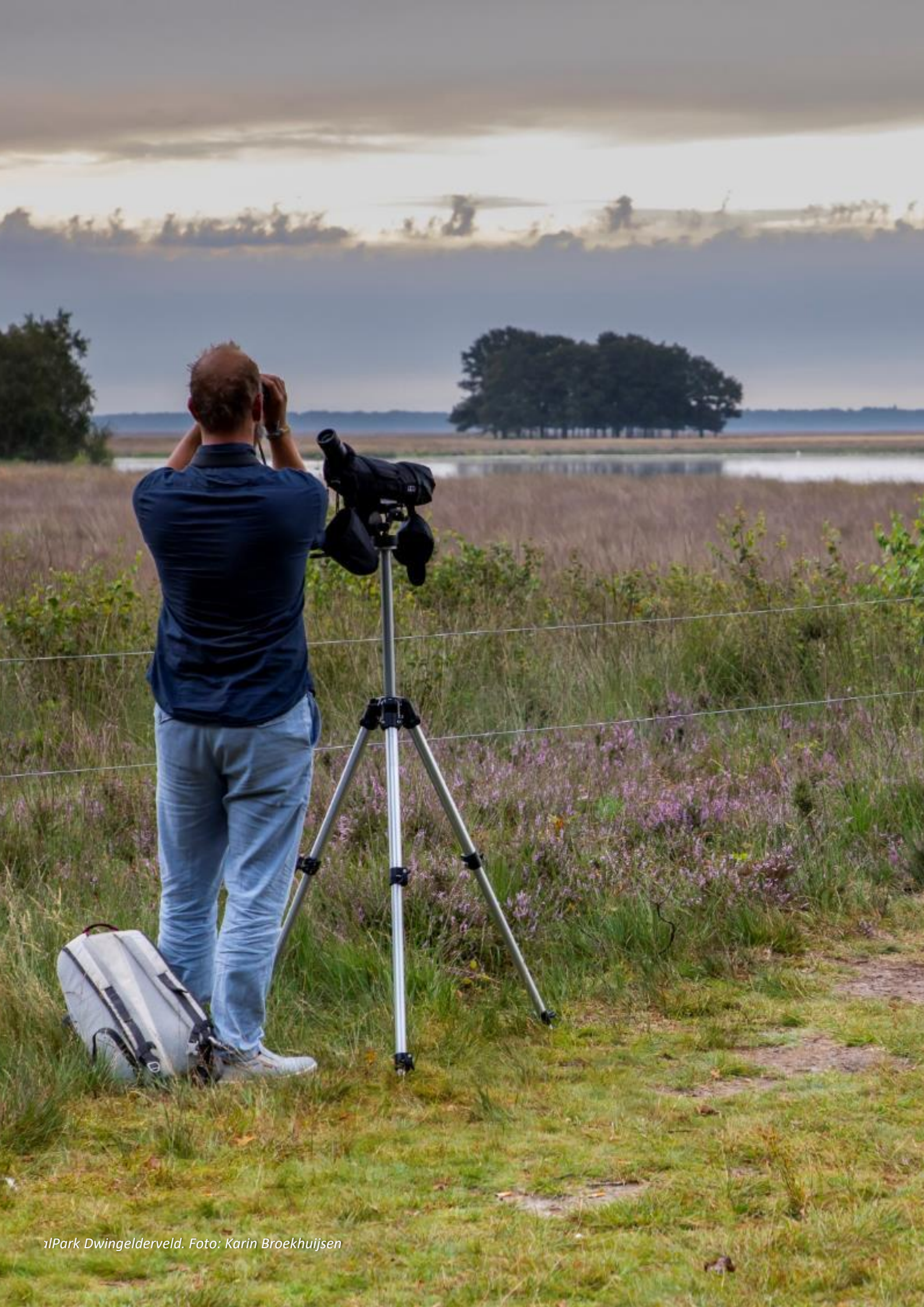
nlPark Dwingelderveld.