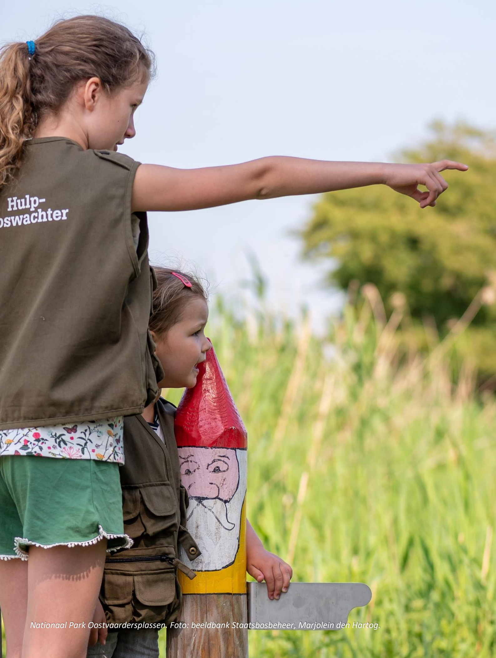
Nationaal Park Oostvaardersplassen.