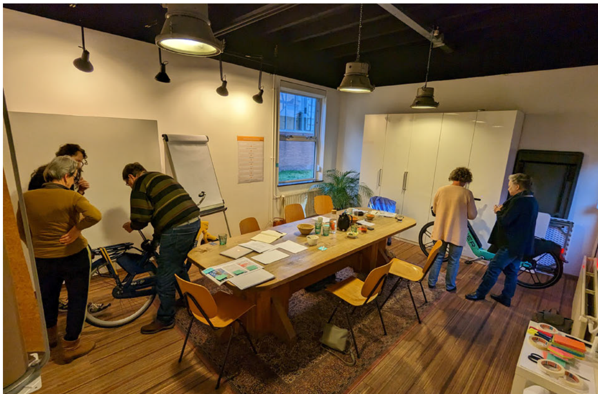
Foto van de focusgroep met minder digitaal vaardigen. Tijdens de focusgroepsessie is onder andere de gebruiksvriendelijke van twee typen deelfietsen besproken.

Er is gesproken met ouderen (>15) en mensen met dyslexie of laaggeletterdheid (4). Circa 50% was in bezit van een rijbewijs en eigen auto. Sommige kozen bewust voor het openbaar vervoer.