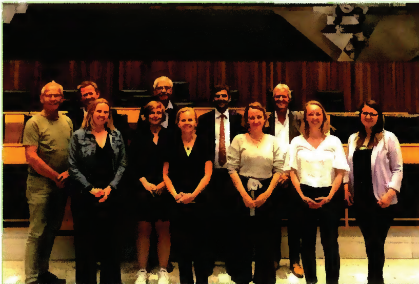
Bezoek aan Südtiroler parlement, met vice-president en FUEN-bestuurslid Daniel Alfreider (Südtiroler Volkspartei).

Bestuur en staf van DINGtiid, voor de gelegenheid aangevuld met een externe onderzoeker, hebben in het kader van het adviesdossier 'Fries in de voorschoolse fase' van 29 mei tot en met 1 juni 2022 een studiereis gemaakt naar Zuid-Tirol, Italië. In die regio wordt Italiaans, Duits en Ladinisch gebruikt en onderwezen. Het belangrijkste doel van de studiereis was om informatie op te halen over hoe meertaligheid in de gemeenschap leeft en fungeert – met nadruk op de voorschoolse fase – en hoe dat op politiek en onderwijskundig gebied handen en voeten krijgt.