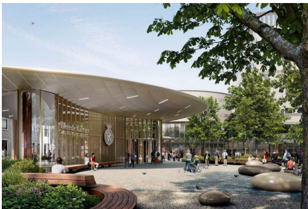
2. Publieksentree Tweede Kamer.

Zoals in de vorige rapportage aangegeven zal eind 2023 de voor de entree benodigde omgevingsvergunning worden aangevraagd. De omgevingsvergunningen van de bestaande gebouwdelen waren al aangevraagd. De vergunning voor de niet monumentale gebouwdelen is op 17 april 2023 afgegeven en die voor de monumentale gebouwdelen is 21 augustus 2023 verleend. Voor de laatste loopt de beroep- en bezwaartermijn tot begin oktober.