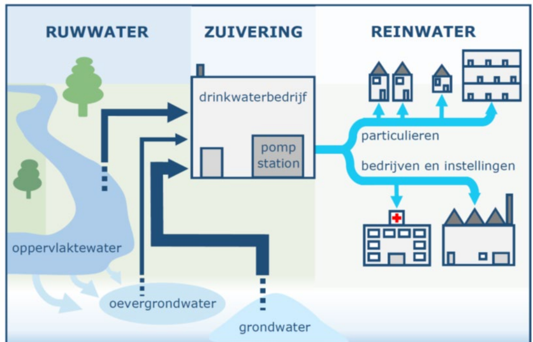
Figuur 2: Drinkwatervoorziening van bron tot tap

In 2022 voerden drinkwaterbedrijven gezamenlijk 559.933 metingen van wettelijke verplichte parameters uit na de laatste zuiveringsstap ('af pompstation') en in het distributienet ('aan het tappunt'). Zie ook Figuur 2. Daarnaast voerden de drinkwaterbedrijven ook metingen uit na werkzaamheden, klachten of incidenten. Deze metingen behoren echter niet tot het reguliere wettelijke meetprogramma en worden apart behandeld in Hoofdstuk 4 Normoverschrijdingen na werkzaamheden, incidenten en klachten.