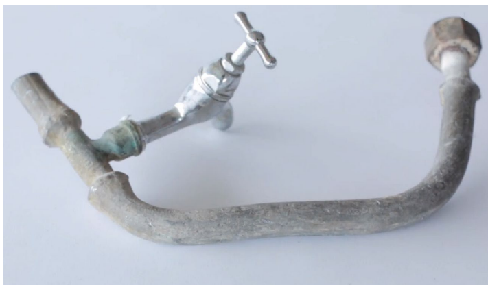
Figuur 3: Loden leiding

Op 2 juli 2020 hebben de ministers van Binnenlandse Zaken en Koninkrijksrelaties, Infrastructuur en Waterstaat en van Medische Zorg in een gezamenlijke brief de Tweede Kamer verder geïnformeerd over welke acties er tot dan toe samen met diverse betrokkenen zijn ingezet en wat de (vervolg)aanpak inhoudt. In deze brief is voor de monitoring van lood in drinkwater onder meer aangegeven dat de reguliere monitoring door de drinkwaterbedrijven ook in de toekomst gebruikt wordt voor een globaal inzicht in de verdere ontwikkeling van de aanwezigheid van lood in drinkwater. De analyse van de individuele loodmetingen in de distributiegebieden van de drinkwaterbedrijven is daarom in de vorige rapportages uitgebreid met de metingen van 2019 tot en met 2021. In deze rapportage zijn ook de metingen van 2022 toegevoegd.