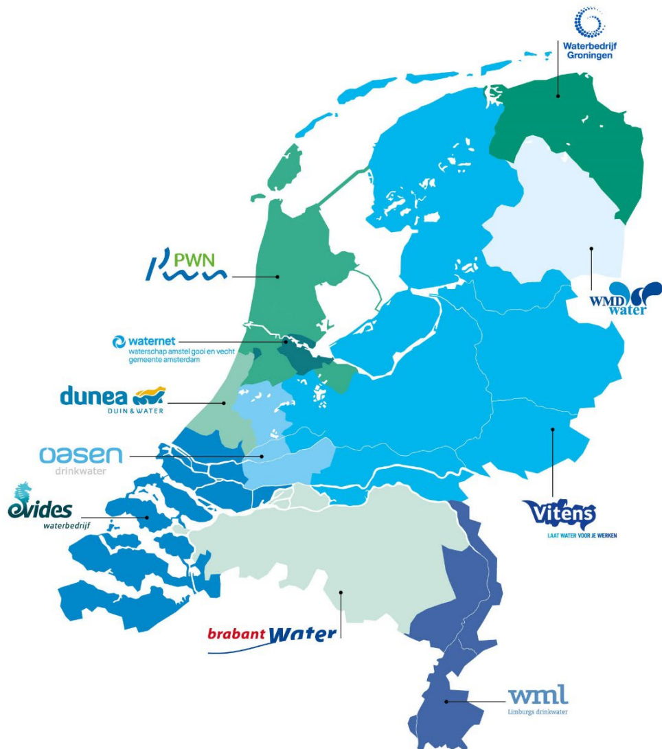
Figuur 1: Distributiegebieden van Nederlandse drinkwaterbedrijven