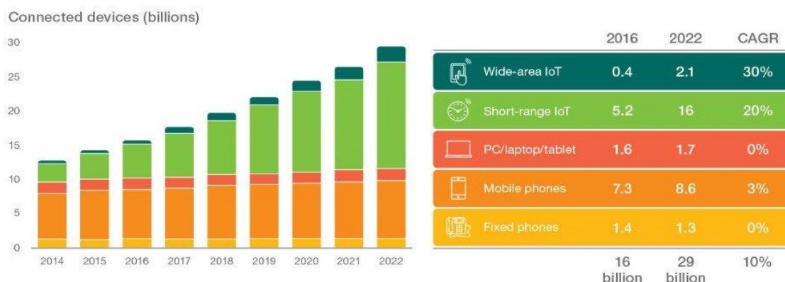
Figuur 1: Wereldwijd aantal verbonden apparaten, voorspelling van Ericsson 8 .

Naast de maatschappelijke trends "energietransitie" en "klimaatverandering" zijn er diverse technologische trends. Een ervan is de ontwikkeling rondom 5G (en 6G) en Internet of Things (IoT). De groeiende datastromen vertalen zich in de wens om hogere frequenties met complexe elektromagnetische velden te gebruiken, zowel ruimtelijk als wat betreft modulatie en codering. Nederland heeft hier een naam hoog te houden op technologisch gebied. Zo is Bluetooth uitgevonden door Jaap Haartsen, en ook Wifi/WLAN is een Nederlandse uitvinding 7 . Ericsson voorspelt dat er in 2022 1.5 miljard draadloze apparaten in gebruik zullen zijn 8 , zie Figuur 1. De meeste van deze apparaten zullen werken met veel hogere frequenties dan nu gebruikelijk is.